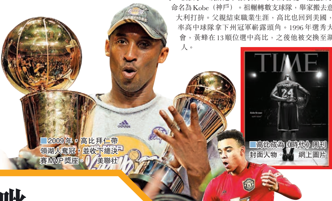
■2009年，高比拜仁帶領湖人奪冠，並收下總決賽MVP獎座。