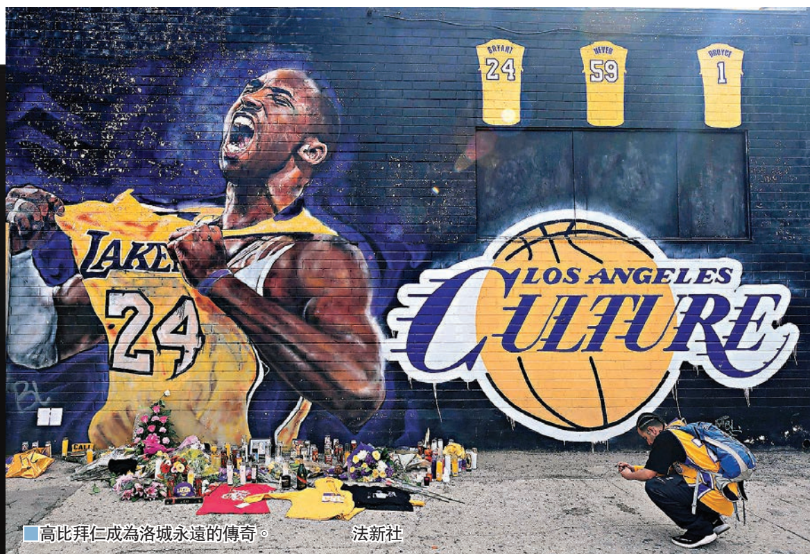
高比拜仁成為洛城永遠的傳奇。

美國NBA傳奇巨星高比拜仁當地時間26日不幸墜機辭世，整個籃球界以至體壇都瀰漫一片傷痛。大批市民到他生前唯一母會洛杉磯湖人的主場外致哀，多位NBA球星和體壇名將也紛紛發文悼念這位一代傳奇突然的撒手塵寰。 ■香港文匯報記者 梁志達