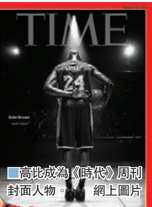
■高比成為《時代》周刊封面人物。