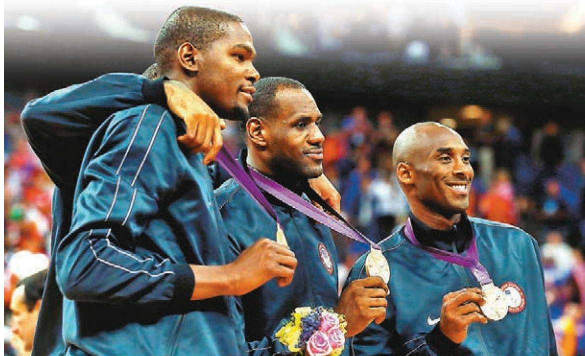
▲2012年倫敦奧運會，(左起)杜蘭特、勒邦占士與高比幫助美國隊勇奪金牌。