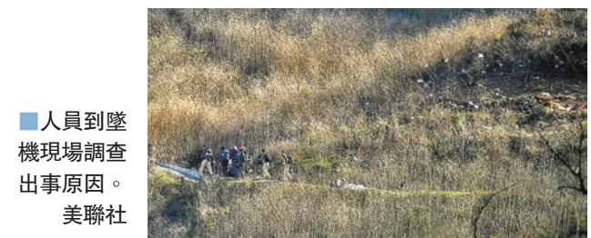
人員到墜機現場調查出事原因。 美聯社

高比拜仁與二女乘私人直升機墜毀，機上9人全數罹難。TMZ引述飛行追蹤記錄與多位擁有洛杉磯地區豐富飛行經驗的直升機飛行員指出，機師當時遇大霧沒減速也沒拉高跡象，可能因此撞山。事發時直升機在洛杉磯動物園附近區域打轉了15分鐘，看似本想放棄飛行。據悉直升機當日獲得名為「特種目視飛航規則」的許可，代表可在濃霧的當時穿越貝班克空域，機師決定繼續在濃霧深罩的山區飛行是否正確，很可能將是事件調查的核心。 ■中央社