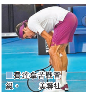
■費達拿苦戰晉級。

救下7個賽點，險勝7：6，最終第5盤贏6：3晉級，4強將門同日直落3盤贏拉奧歷的祖高域。費達拿感嘆：「我在處下風時告訴自己要相信奇跡，今仗我難以置信地幸運……」