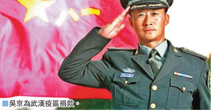
吳京為武漢疫區捐款。網上圖片

中華思源工程扶貧基金會：#與思源一起馳援湖北疫情 #抗击新型冠状病毒我们在行动#肺炎疫情牵动民心，一方有難八方支援，特別感謝@汪峰 @章子怡 夫婦向中華思源工程扶貧基金會捐款100萬元，和我們一起參與“疫情防攻堅戰”，助力抗擊新型冠狀病毒第一線奮鬥者，我，迎難而上的醫務工作者們。武漢加油！中國加油！一份愛心一份力量，共抗疫情