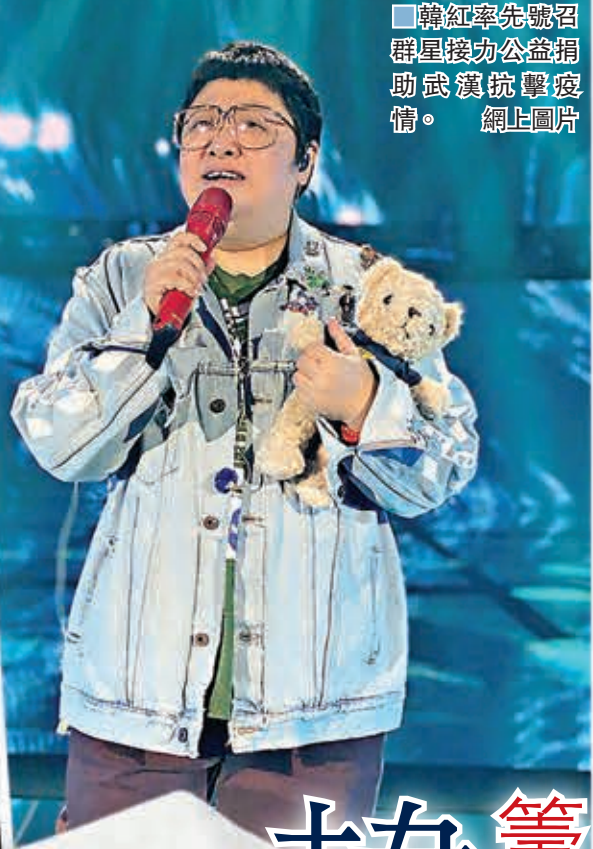
韓紅率先號召群星接洽公益捐助武漢抗擊疫情。