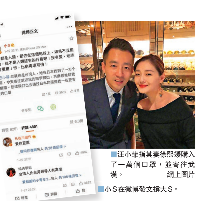
汪小菲指其妻徐熙媛購入了一萬個口罩，並寄往武漢。網上圖片

災難面前，人人都獻出一片愛心，其中王祖藍、李亞男夫婦及羅晉、唐嫣夫婦各為武漢疫區捐款50萬；汪峰、章子怡夫婦向中華思源工程扶貧基金會捐款100萬；馮紹峰、趙麗穎夫婦也捐款100萬；黃曉明和Angelababy夫婦及吳京、謝楠夫婦捐款，用於購買口罩幫助白衣天使，黃曉明還表示：「他們是我們心中的英雄！」王嘉爾以粉絲的名義向武漢捐款20萬，其粉絲亦籌集12.8萬，最後合共捐出的是32.8萬。