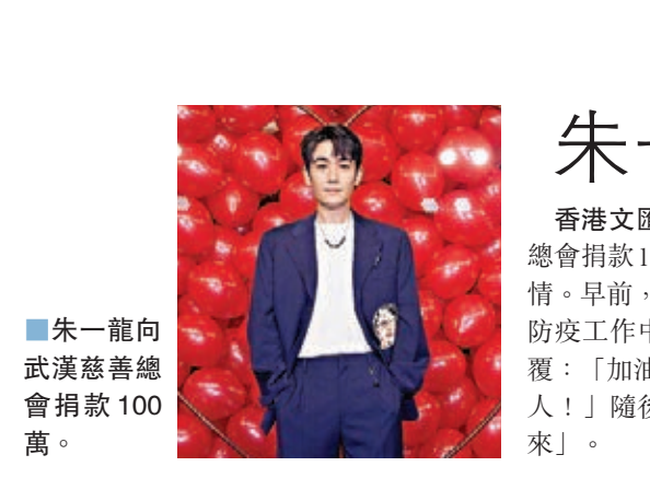
朱一龍向武漢慈善總會捐款100萬。

香港文匯報訊（記者姜亭）面對疫情蔓延，奮鬥在前線的醫護人員仍不辭勞苦，日以繼夜照顧病人，他們是人民心中的英雄！香港藝人包括楊明、曹永康、關楚耀、莊思敏、唐文龍、姚瑩瑩、何俊軒、李逸朗、蔡淇俊、程芷渝日前紛紛拍片以支持一眾醫護人員，藝人拍片支持一班勞苦功高的醫務人員，更為他們點讚，希望他們在工作的同時能注意自己的安全。 楊明說：「我祝全國人民身體健康、鼠年大吉！雖然這次的病毒很可怕，但我們中國人是有愛心的，那我們就用愛去對抗病毒吧，還有全國的白衣天使們真的辛苦了，謝謝你們的付出，特別