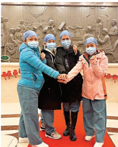
中山大學孫逸仙紀念醫院4名護士在出發前合影。

就沒有喝水。奮戰一晚走出醫院時，和煦的陽光灑在身上，讓他忘了疲累。「陽光真好！感覺真好！」