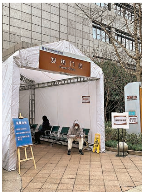
患者無需經過醫院大門即可抵達發熱門診。