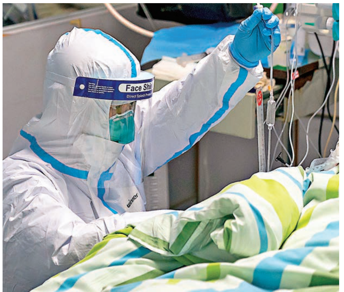
在武漢投入工作的廣東第一批醫療隊的一線「戰疫日記」中，有不少溫情和感人的瞬間。圖為1月24日在武漢大學中南醫院重症隔離病房，醫護人員正為病人治療。新華社