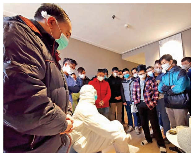
廣東中醫醫療隊抵達武漢後開展戰前培訓。