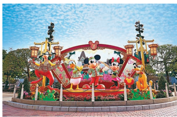
米奇及好友在園內作新春佈置