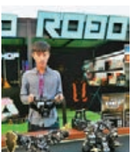
機械人大戰，用身體動作控制機械人進行格鬥。