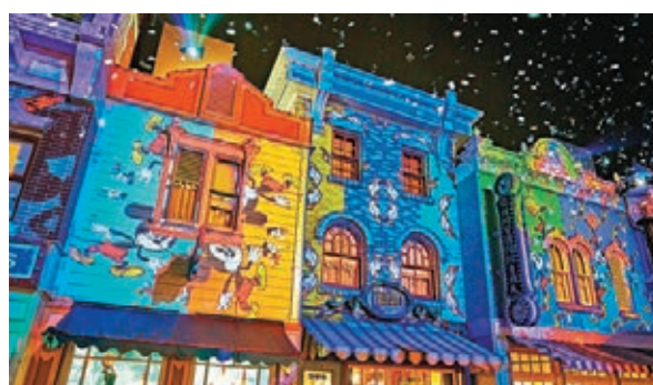
新春特別版「We Love Mickey！」大街投影盛演。