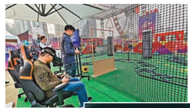
無人機障礙賽，用手控制無人機穿越場地內各種障礙。