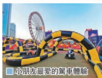
小朋友最愛的駕車體驗

一如以往，這個新春的中環海濱廣場，仍是友邦嘉年華的所在地，他們繼續把刺激好玩的體驗帶給香港市民，以新奇前衛的面目登場，帶來超過60款有別於從前的精彩活動、攤位和機動遊戲。例如，大家可以在50米高空乘坐Mach 5飽覽360度的香港景色，或坐上Dodgems碰碰車一嘗橫衝直撞的快感、在Pony Adventure策馬奔馳、讓懷舊旋轉木馬Carousel帶你回到過去，還可以一邊享受美食，一邊欣賞舞台表演，一家大小樂而忘返。今年，有兩項遊樂設施值得留意，Ghost Train，怪異的火車會帶領大家穿越食屍鬼、地精和其他世俗生物，以舒適的速度穿越鬼屋。而Mad Mill/Wipeout充氣裝置則由空氣填充的桿子組成，桿子的擺動速度非常快，玩家需要避開桿，但是隨着桿的擺動，他們也可以躲開。另外，剛於一星期前，在入口位置附近，友邦嘉年華團隊首次與Drone Racing Association (DRA) 亞太區公司合作將電子競技引入嘉年華，在香港首次舉辦無人機戶外商業活動，為大眾提供第一人稱視角無人機飛行體驗的機會。活動在大型無人機籠中舉行，獲得香港民航局首次進行第一人稱視角無人機戶外商業活動的飛行許可。嘉年華團隊更與Techbob Academy合作，將無人機賽引入今年的STEM教育計劃中，STEM教育計劃於嘉年華1月開始推行至2月16日，為香港學校提供校外活動選擇。除了無人機外，DRA活動區還設有其他遊戲，如第一人稱視角無人機賽車，Ganker EX Battle Robot，Win Win Group的STEM機器人Zenbo，以及HTC Vive的VR遊戲體驗，無論科技或電子競技愛好者，均可於嘉年華體驗各項電子活動。