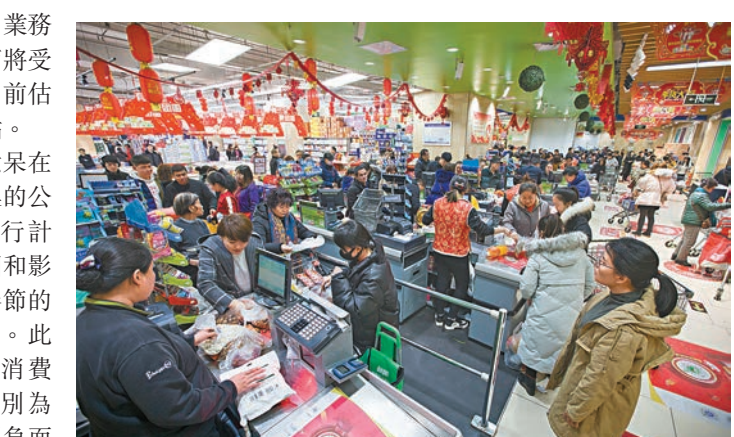
武漢肺炎疫情出現擴散，瑞銀證券料消費者在家做飯的情況增多，包裝食品及食品零售商可能會獲益。

由於消費者在家做飯的情況增多，包裝食品及食品零售商可能會獲益。在線視頻、端遊(客戶端遊戲)/手遊和電商或微微獲益於這種行為轉變。此外，沒有藥物/疫苗能即刻治療或預防這種新型病毒，但這種情況或提升對疫苗/體檢的需求。