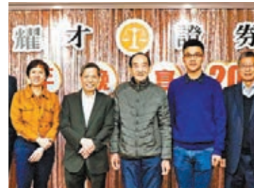
耀才日前舉行周年晚宴

此外，儘管香港經濟前景未明及百業蕭條，但為感謝全體員工去年不辭勞苦的付出，耀才還宣佈派高八位數的年终奖予全體員工，部分卓越表現員工更獲超過10個月的極優厚花紅。適逢庚子鼠年將至，耀才日前舉