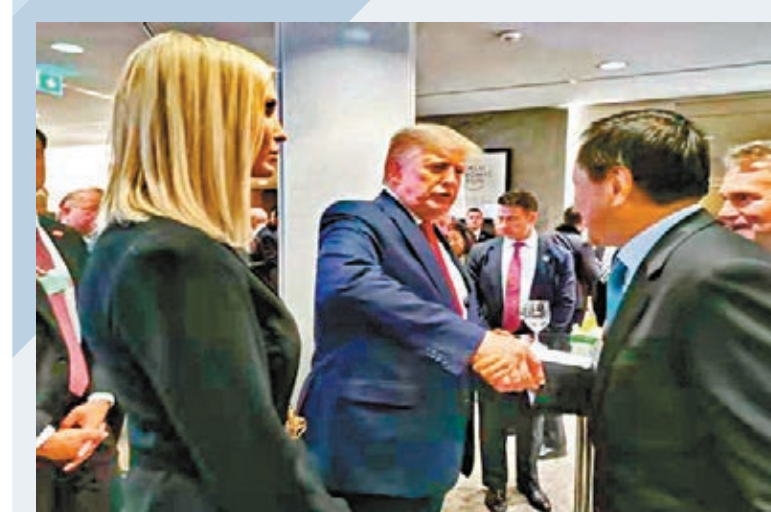
李·小·加·偶·遇·特·朗·普 瑞士達沃斯世界經濟論壇前日揭幕。

鮑克運亦透露，金管局與泰國央行去年第三季聯同兩地10間銀行，包括匯豐和眾安在內的2間香港銀行，共同開發跨境資金轉撥