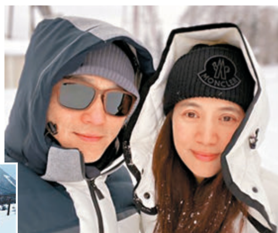
Chilam與靚靚早前去滑雪。

娜姐表示春節有幾天假期，她將會留港度歲休息，DaDa則表示要是需要去跑戲院謝票，她一定出席支持。對於今年有四部港產賀歲片上映，DaDa喜見影圈百花齊放，看自己演出的賀歲片外，也會入場支持其他電影。