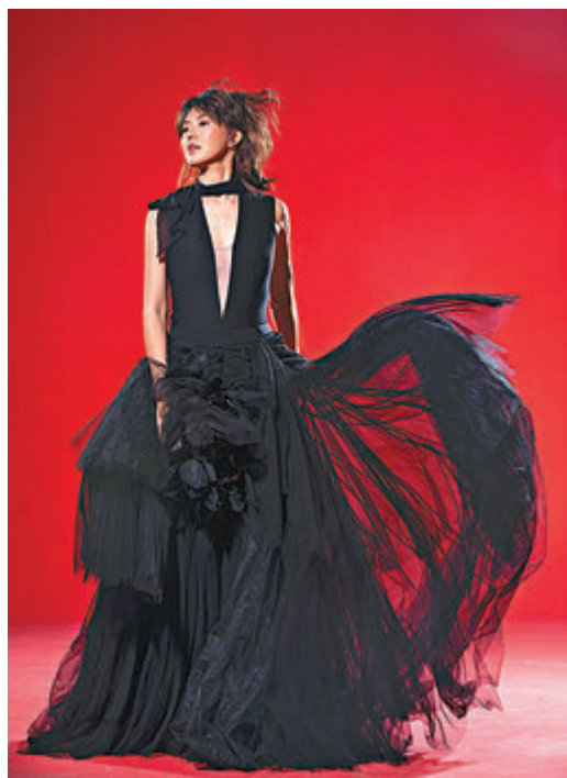
睽違5年，孫燕姿再開巡唱。

文諺語：Make hay while the sun shines；燕姿希望能透過演唱會，讓那麼多年來支持和守護自己的歌迷朋友們齊集，把握最好的當下，一起感受和享受屬於彼此的特別時刻。燕姿去年除了推出單曲《守護永恆的愛》，也助陣五月天演唱會、擔任首場特別嘉賓，更在2020年的第一天加碼和五月天再度合作，攜手送上20周年版《溫柔》作為獻給大家的新年禮物。燕姿近期也參與跨年演出及春節聯歡晚會。即將到來的春節，她先暫時放下手邊的工作，和家人歡聚、共享天倫之樂，待年後將全心投入、為演唱會做準備。