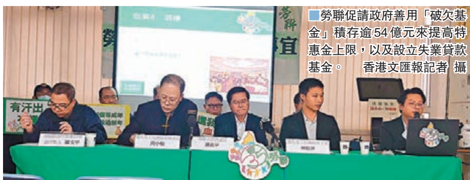
勞聯促請政府善用「破欠基金」積存逾54億元來提高特惠金上限，以及設立失業貸款基金。

香港文匯報訊 (記者 成祖明) 黑暴令全城籠罩在暴力的陰影下，市民消費意慾大減。農曆新年將至，有企業陸續因營運困難而裁員或倒閉，打工仔被拖欠薪金，恐怕「冇錢過年」。港九勞工社團聯合會近期接獲數百宗裁員個案，超過600人被裁員，其中140人被欠薪，欠薪金額更高達360萬元，有僱員被欠薪長達一年，多是飲食業從業員。有飲食業從業員兩度被拖欠薪金，唯破欠基金申請程序繁複，欠薪補償機制關卡重重，為節省開支曾一天只吃一頓飯。