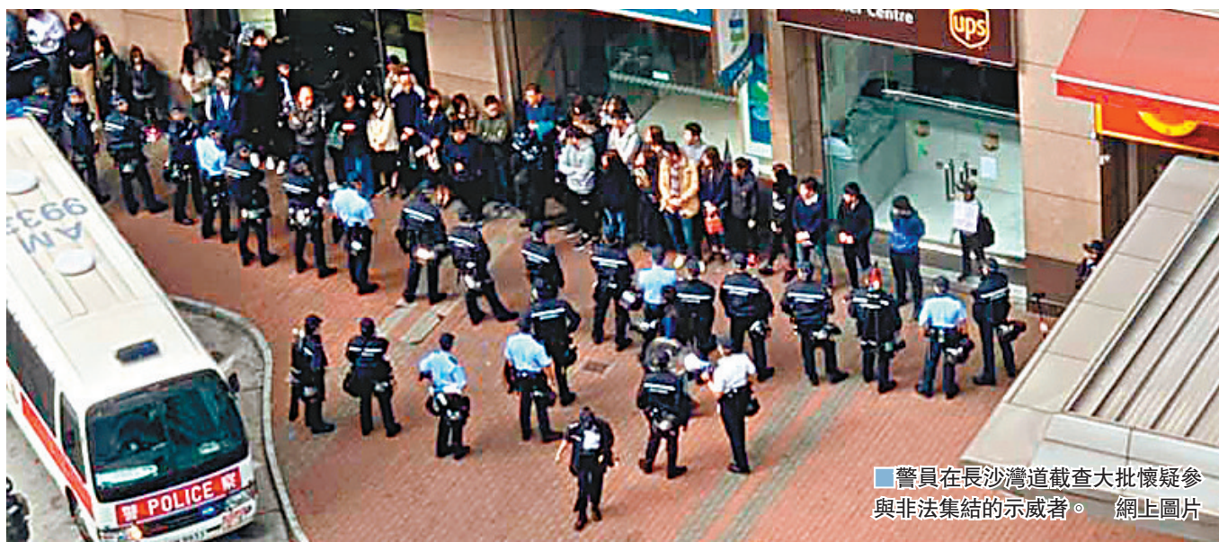
警方在長沙灣道截查大批懷疑參與非法集結的示威者。

另外，昨日下午1時許，一批響應「和你Lunch」活動的示威者，先在長沙灣道香港工業中心對開集結後，再沿長沙灣道行人路步行。有人高舉示威標語及旗幟，大叫口號，有軍裝警員