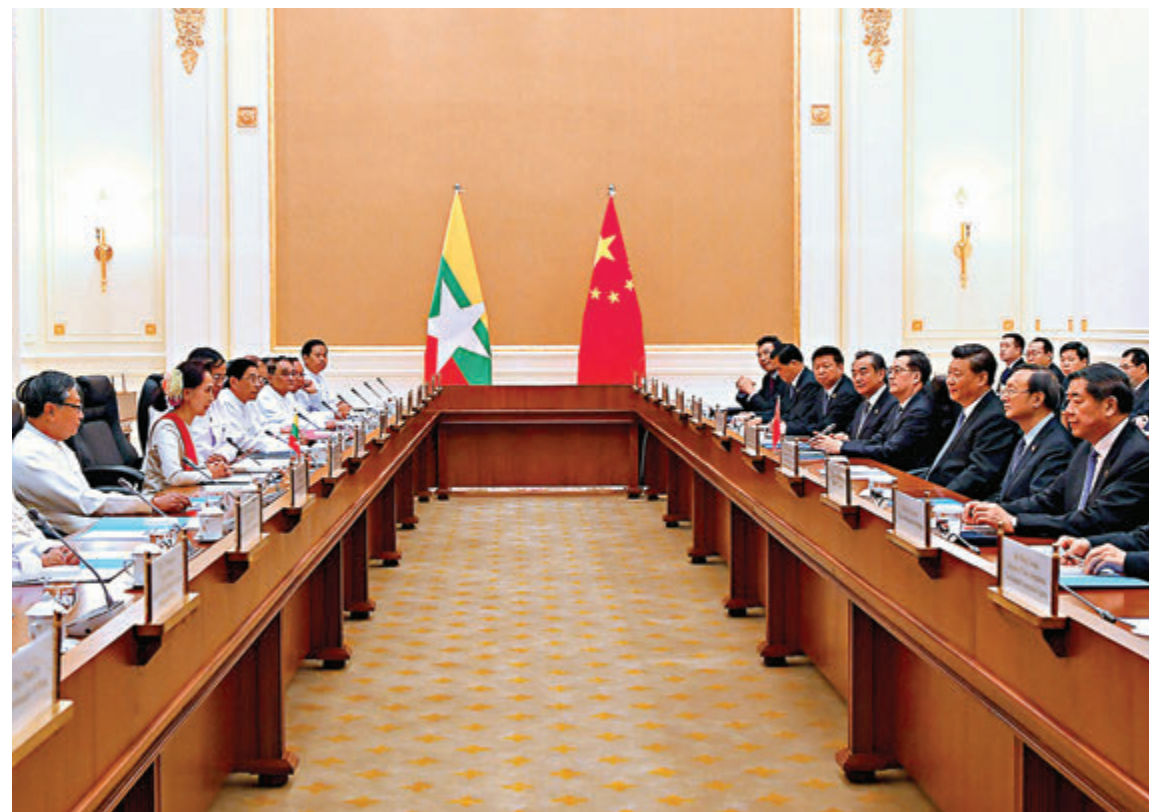
▲當地時間1月18日上午，國家主席習近平在內比都同緬甸國務資政昂山素姬舉行正式會談。