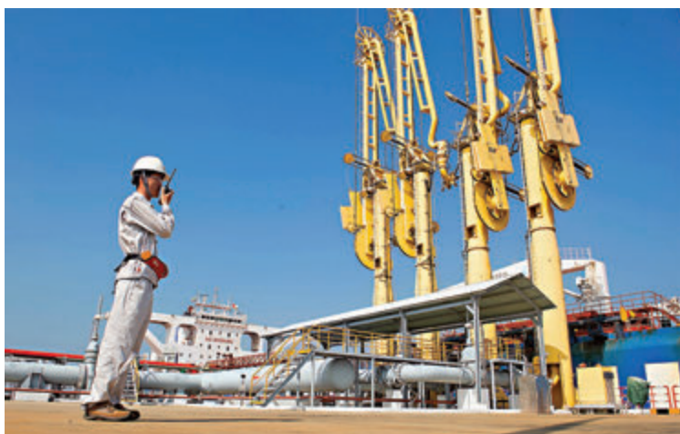
▲一艘油輪停靠在緬甸皎漂馬德島中緬油氣管道項目卸油碼頭。