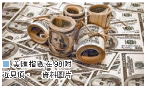
美匯指數在98附近見頂。資料圖片

美匯指數在98附近見頂，預期今年美匯將逐步回落。但中間的上落十分密集。預期年底有機會見93。今年是美國大選年，也適逢經濟見頂年，存在十分多變數。