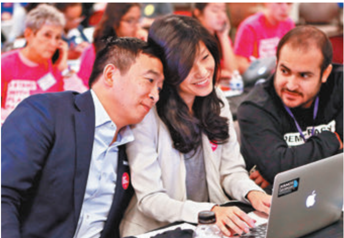
楊安澤(左)的妻子盧艾玲(中)自爆遭性侵。