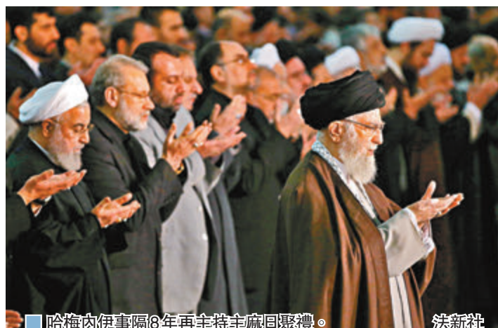
哈梅內伊事隔8年再主持主麻日聚禮。