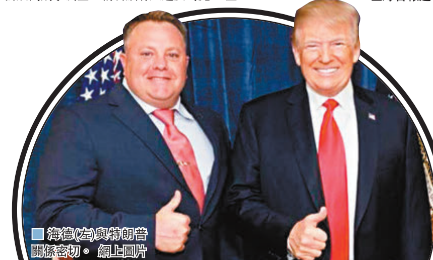
海德(左)與特朗普關係密切。網上圖片