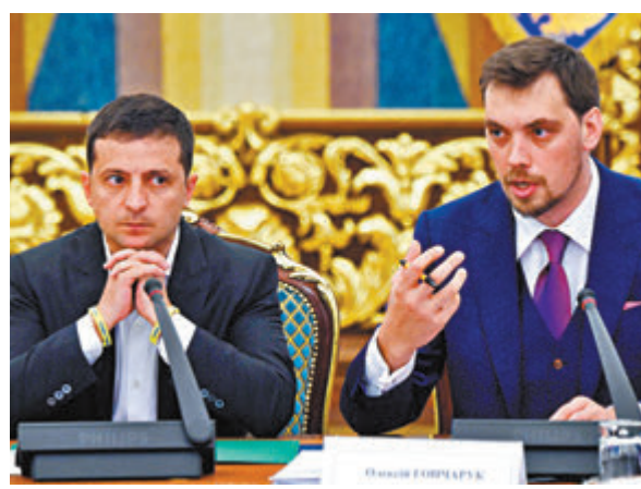
賈恰魯克(右)批評澤連斯基(左)的錄音外洩。