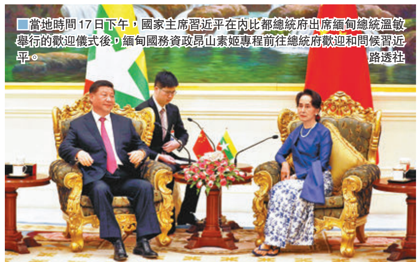
當地時間17日下午，國家主席習近平在內比都總統府出席緬甸總統溫敏舉行的歡迎儀式後，緬甸國務資政昂山素姬專程前往總統府歡迎和問候習近平。

習近平感謝緬甸政府和人民給予的盛情歡迎。習近平表示，這次我作為國家主席首次訪問緬甸，也是今年我首次出訪，雙方將共同慶祝並啟動中緬建交70周年系列活動，具有重要意義。中方堅定支持緬甸走自己選擇的發展道路，願鞏固和深化兩國和兩國人民之間的「胞波」情誼，不斷賦予其更豐富內涵，共同構建中緬命運共同體。