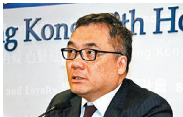
李桂華高級警司講述案情。