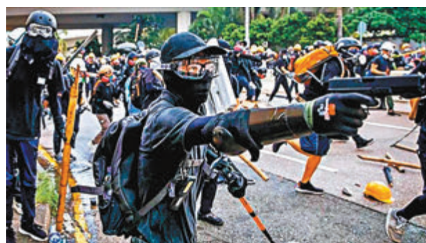
暴動中曾有黑衣人指槍向警察。