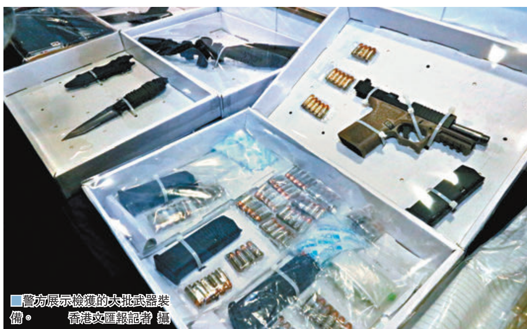
警方展示檢獲的大批武器裝備。

香港文匯報訊(記者蕭景源)地區包裹加強抽調，但始終有漏網之魚，加上現時物流發達，收發貨品方便快捷，也令不法分子有機可乘。特別是為快遞公司和顧客節省成本的集運服務，也提供免費存倉服務，顧客可憑摺自取，不必直接送門。只要郵寄者將槍械或子彈填報為其他貨品，而收貨人用假名假資料，貨品只要避過海關抽查，收貨人到快遞公司自取，便可避過警方追查身份或住址。