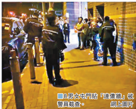
8男女屯門貼「連儂牆」被警員截查。網上圖片

事發於昨凌晨3時，警方接報指有一批人在龍門路新屯門中心，輕鐵龍門站行人天橋處對開聚集，形跡可疑。警員拖至當場截獲8名男女，並於部分人身上搜獲一批政治宣傳海報、電鑽、膠索帶、油掃、膠水等物品，而附近天橋柱位則被人剛貼上文宣海報，海報式樣與疑人身上搜獲的相同，警方調查後相信該批男女擬違法建立所謂的「連儂牆」，遂以管有物品意圖損毀他人財產罪將各人拘捕，帶返青山警署查。