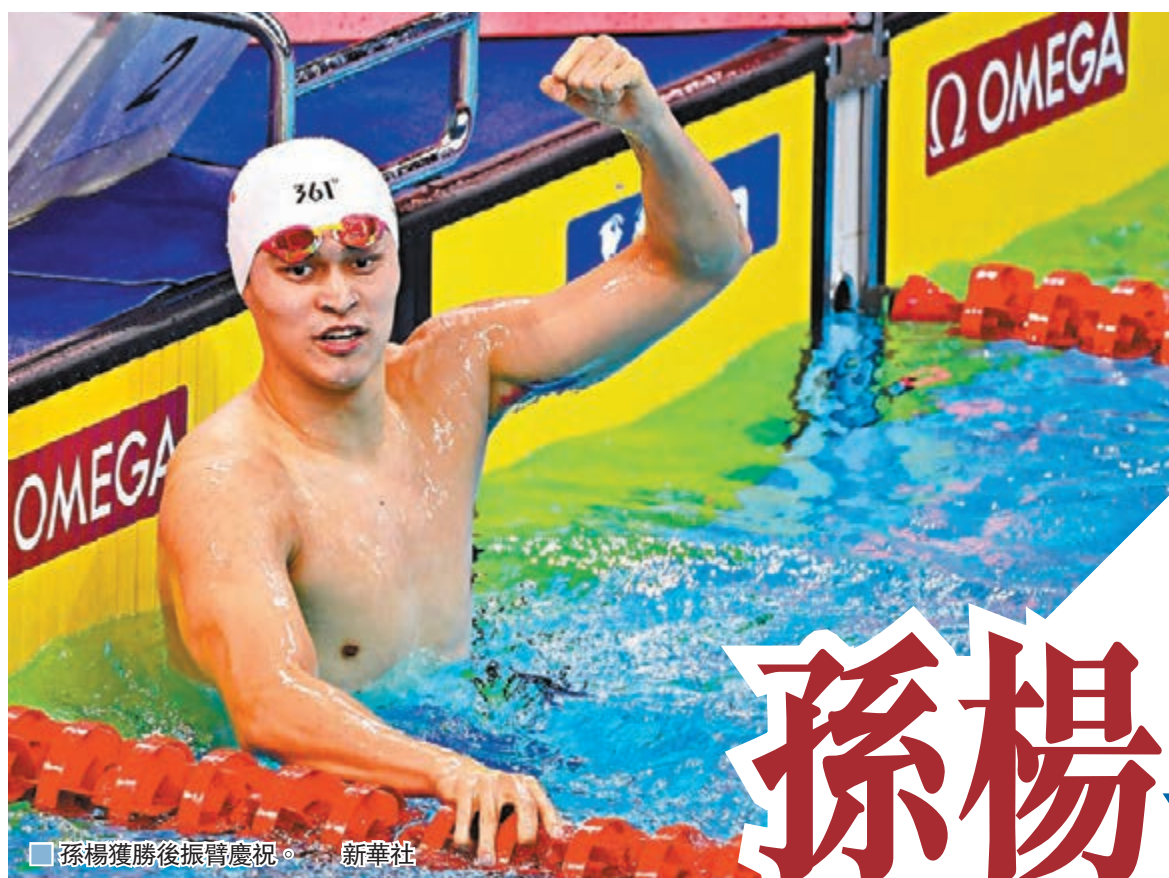
孫楊獲勝後振臂慶祝。