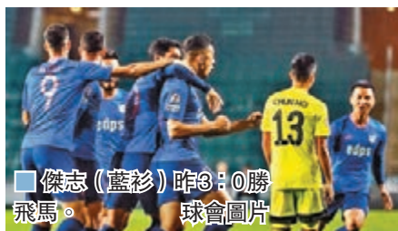
傑志(藍衫)昨3:0勝飛馬。