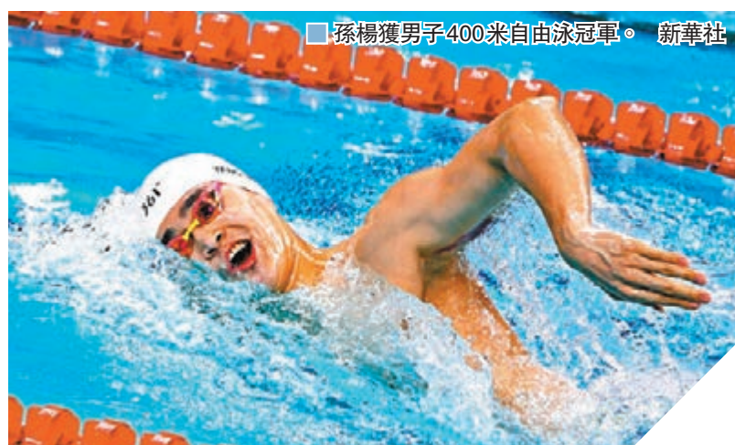
孫楊獲男子400米自由泳冠軍。

經歷了0.03秒錯失金牌的遺憾後，孫楊在2020年的首個冠軍並未讓外界等待太久。15日晚，他在FINA游泳冠軍系列賽深圳站男子400米自由泳的比賽中率先觸壁，再一次證明了自己強大的心理和實力。