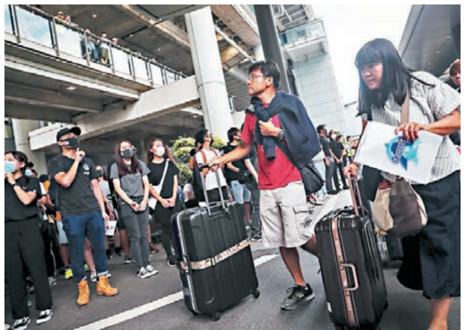
持續半年的暴力示威嚇怕旅客不敢來港。圖為2019年9月時兩名旅客在香港機場遇上示威者。

媒訪問時則表示，受持續7個多月的示威活動影響，訪港旅行團的數目已「近乎無」，不少旅行社已暫停營運幾個月，相信在新一年會有更多旅行社會暫停