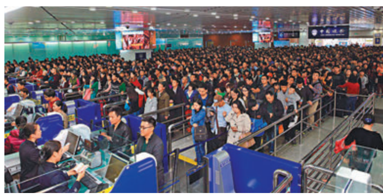
拱北口岸近年來穩居「全國陸路第一大口岸」。