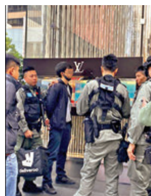
網傳集會現場附近，一名外賣速遞員被捕。

據悉，警方當日為應對公眾集會可能引發的騷亂或暴力破壞，派出大批人員在集會現場附近一帶巡邏及截查可疑者，行動中一共拘捕3男1女(13歲至25歲)，並在他們身上搜獲伸縮棍、扳手、濾罐、噴膠、頭套及索帶等物品。他們同涉「藏有工具可用作非法用途」被捕，案件現交由中區警區刑事調查隊跟進。