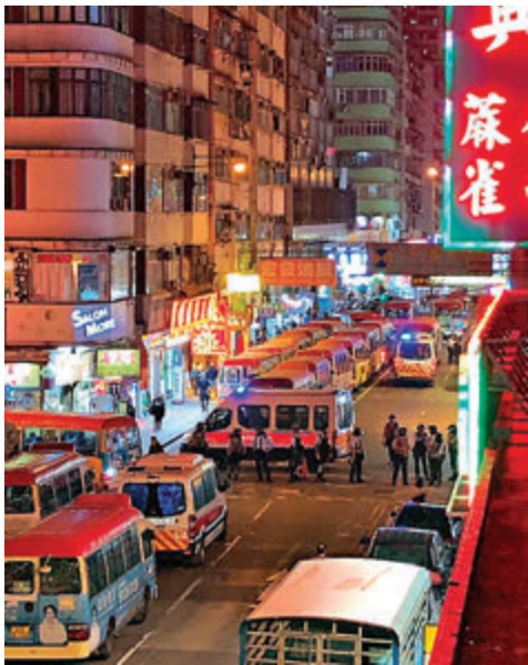
消防及警方爆炸品處理人員到場，並拉起封鎖線，疏散附近市民。

發現的水管炸彈長約8吋、重約1.5磅，內藏炸藥約40克，警方爆炸品處理人員經風險評估後，決定在現場拆除。現場所見，爆炸品處理人員將一批引爆炸藥搬上樓，當中包括已撒水浸濕的沙包。及至晚上11時許，大廈傳出一下巨響聲，警方成功將有關爆炸品拆除，但其間曾發生輕微爆炸，無人受傷，惟附近升降機門被炸彈碎片炸