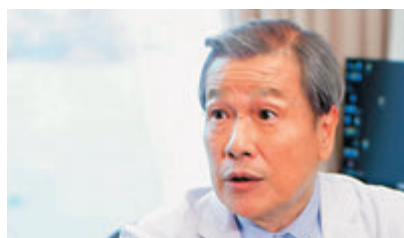
劉江為無錢的資深甘草演員。

香港文匯報訊（記者 達里）有「劉老師」之稱的資深演員劉江前晚盛裝出席《萬千星輝頒獎典禮》，他大方透露與TVB結束37年賓主關係，近日要清假的他特意回來支持劇集《金宵大廈》。對於沒有續約劉老師似有難