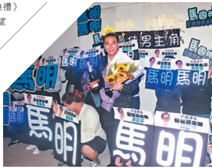
馬國明榮登視帝，與粉絲熱烈慶祝。

香港文匯報訊（記者 達里）《萬千星輝頒獎典禮》14個獎項前晚順利頒發完成，馬國明（馬明）眾望所歸憑劇集《白色強人》首嚐視帝滋味，他繼續以招牌「天然呆」領獎，十分搞笑。而視后則由惠英紅獲得，實現影視大滿貫。楊千嬅憑劇集《多功能老婆》首獲「最受歡迎電視女角色」獎，更提議與惠英紅等合作開拍《多功能奶奶》，由她親自撰寫劇本。