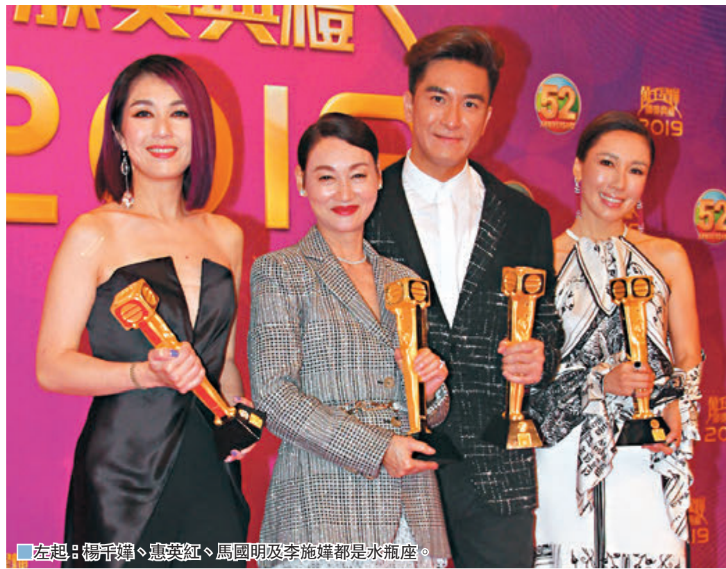
左起：楊千嬅、惠英紅、馬國明及李施嬅都是水瓶座。