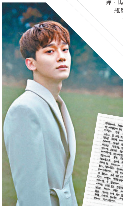
EXO的主唱Chen爆出即將成為人夫的消息，震動娛圈。