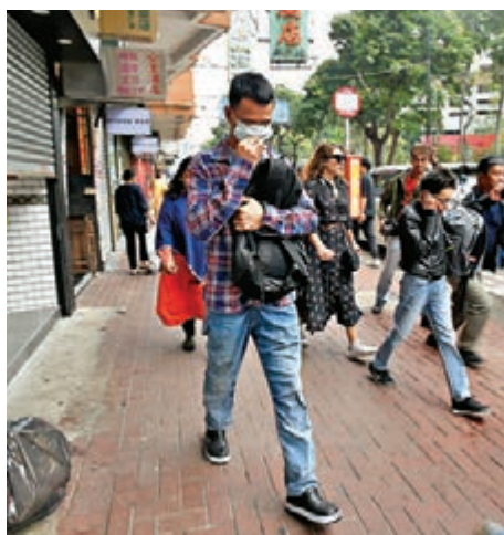
遭毆劫內地事主(格仔衫)隨警員返署助查。