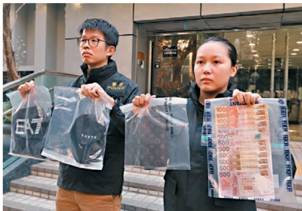
探員展示檢獲的銀包、現金及犯案衣物等。

據悉，被捕的3名16歲少年同鄉長大，自小相識而成為鄰內童黨，並有黑社會背景，其中一人仍在就學，另兩人早前輟學。消息稱，警方初步懷疑3名被捕者中，有兩人落手，一人負責把風，當中一人在與事主糾纏時跌下名牌銀包，內有其身份證。