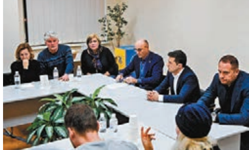
■ 澤連斯基(右二)日前與失事飛機機組人員家屬會面。