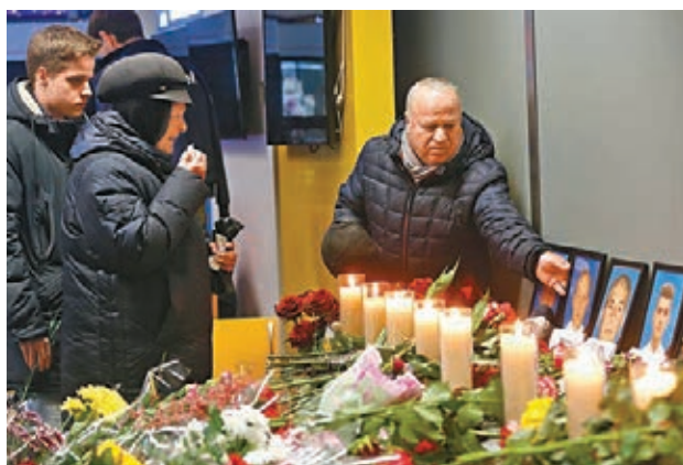
■ 親友哀悼失事飛機機組人員。 美聯社

伊朗傳媒則報道，伊朗最高精神領袖哈梅內伊及魯哈尼是前日獲告知調查結果，前者隨即下令召開國家安全會議，並於會後要求盡快公佈調查結果，當局於是決定由伊朗軍方及魯哈尼分別發聲明公佈事件。哈梅內伊又下令