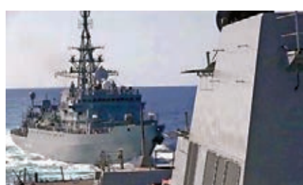
■ 一艘俄羅斯軍艦朝美軍「法拉格特」號的船尾快速靠近。 路透社

「法拉格特」號是美軍「林肯」號戰鬥群中一艘軍艦，去年底因應美國與伊朗關係緊張而部署中東。美國有線新聞網絡(CNN)稱，今次事件是美俄部隊近距離接觸的最新例子，去年6月美俄軍艦曾於太平洋互相逼近危險距離，最終美艦緊急轉變航道，避過碰撞。 ■ 法新社/美聯社/路透社