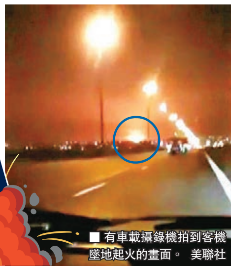
■ 有車載攝錄機拍到客機墜地起火的畫面。

不認不認還須認，經過多日否認後，伊朗昨日終於承認上周三在德黑蘭失事墜毀的烏克蘭國際航空客機，是遭到伊朗軍方「非故意」擊落，乃「人為錯誤」所導致。伊朗總統魯哈尼形容事件為「不可原諒的錯誤」，承諾展開調查並追究責任，不過外長扎里夫仍然將事故歸咎於美國的「冒險主義」，認為如非美國導致緊張局勢升溫，便不會出現今次慘劇。