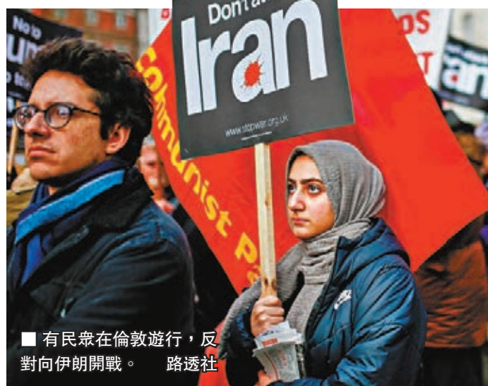
■ 有民衆在倫敦遊行，反對向伊朗開戰。 路透社

烏克蘭國際航空總裁戴克亦發聲明稱，他從沒懷疑旗下客機和機組人員，是引致今次空難的原因，形容機組人員是「最優秀的員工」。烏航副總裁表示，肇事客機起飛前，德黑蘭機場方面並沒有發出警告，他強調該客機並無偏離航道，指伊朗當局應關閉機場。 ■ 法新社/路透社/美聯社