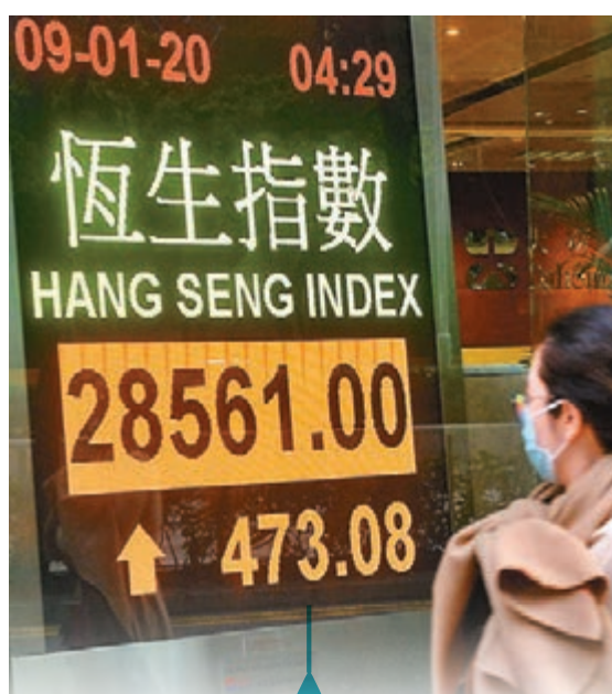
■ 港股昨以全日最高位收，成交額也增至958億元。

香港文匯報訊(記者 周紹基)市場對中東局勢憂慮降溫，加上商務部證實，國務院副總理劉鶴在下周一起訪美3天，並簽署中美首階段貿易協議。消息推動港股裂口高開280點後一直向上，全日急彈473點，以全日最高位28,561點報收，升幅達1.7%，成交額也增至958億元。多個板塊均有追捧，包括科技股、5G股、體育股及物管股等。A股亦受惠，滬綜指昨升0.91%，報3,094點。