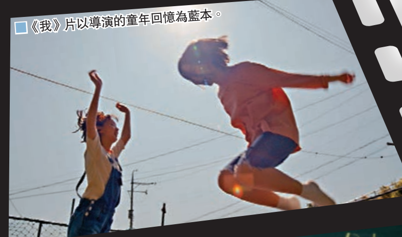
《我》片以導演的童年回憶為藍本。