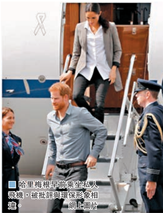
■哈里梅根早前乘坐私人飛機，被批評與環保形象相違。

現時哈里夫婦聘有私人秘書及高級保姆，年薪均達6位數字英鎊，住所亦有管家、私人助理及其他總務等，另外英國政府每年也為哈里夫婦支付保安開支，這些未來不知道會由誰負擔。兩夫婦去年豪斥240萬英鎊(約2,431萬港元)裝修弗洛格摩別墅，如今卻說要大部分時間住在加拿大，有報道指兩人計劃未來支付租金。 梅根婚前的演員工作，單是經營網誌每年收入有6.1萬英鎊(約62萬港元)，若回歸本行，相信收入會較以往為高。不過王室成員以往從事商業活動，經常因為涉嫌利益衝突受到批評，與哈里處境類似的安德魯王子便是個好例子，哈里如何在重蹈叔叔的覆轍下實現財政獨立，將令人拭目以待。 ■綜合報導