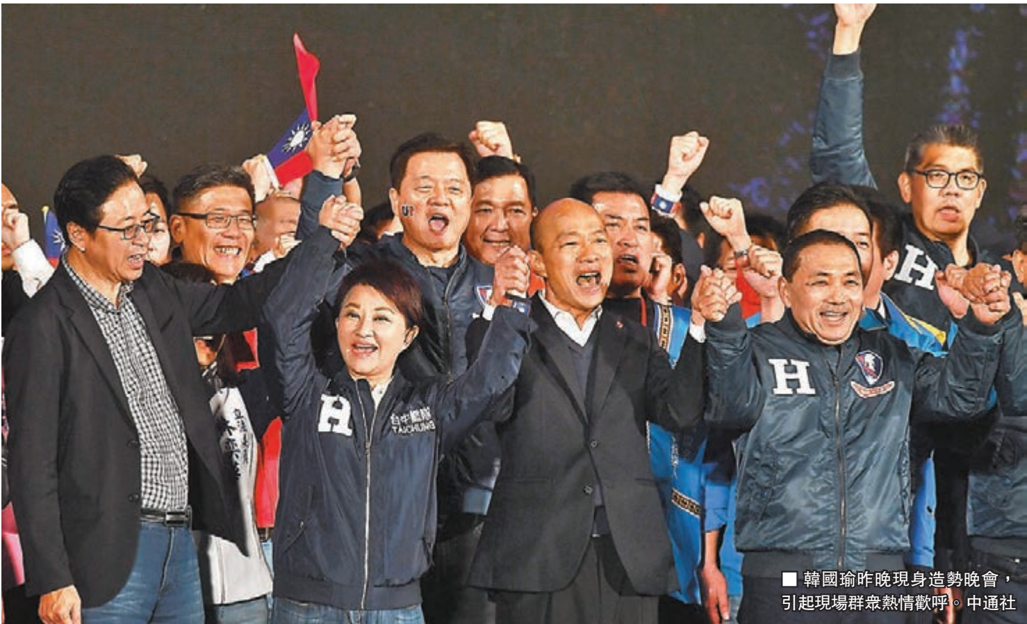
韓國瑜昨晚現身造勢晚會，引起現場群眾熱情歡呼。

韓國瑜說：「我不相信島民會被民進黨繼續欺騙下去，執政拿不出成績單抹黑對手收買媒體，撒錢灑了五千億（新台幣，約合1,318.74億港元）政策買票，我不相信這樣的政府可以繼續連任，讓我們一起來努力找回二三十年前台灣人的光榮，找回台灣人的自豪。」韓國瑜續說，這一場神聖的選戰，他會帶領團隊為台灣人做牛做馬，帶頭往前衝，努力打拚，請大家給他、給國民黨一個機會。