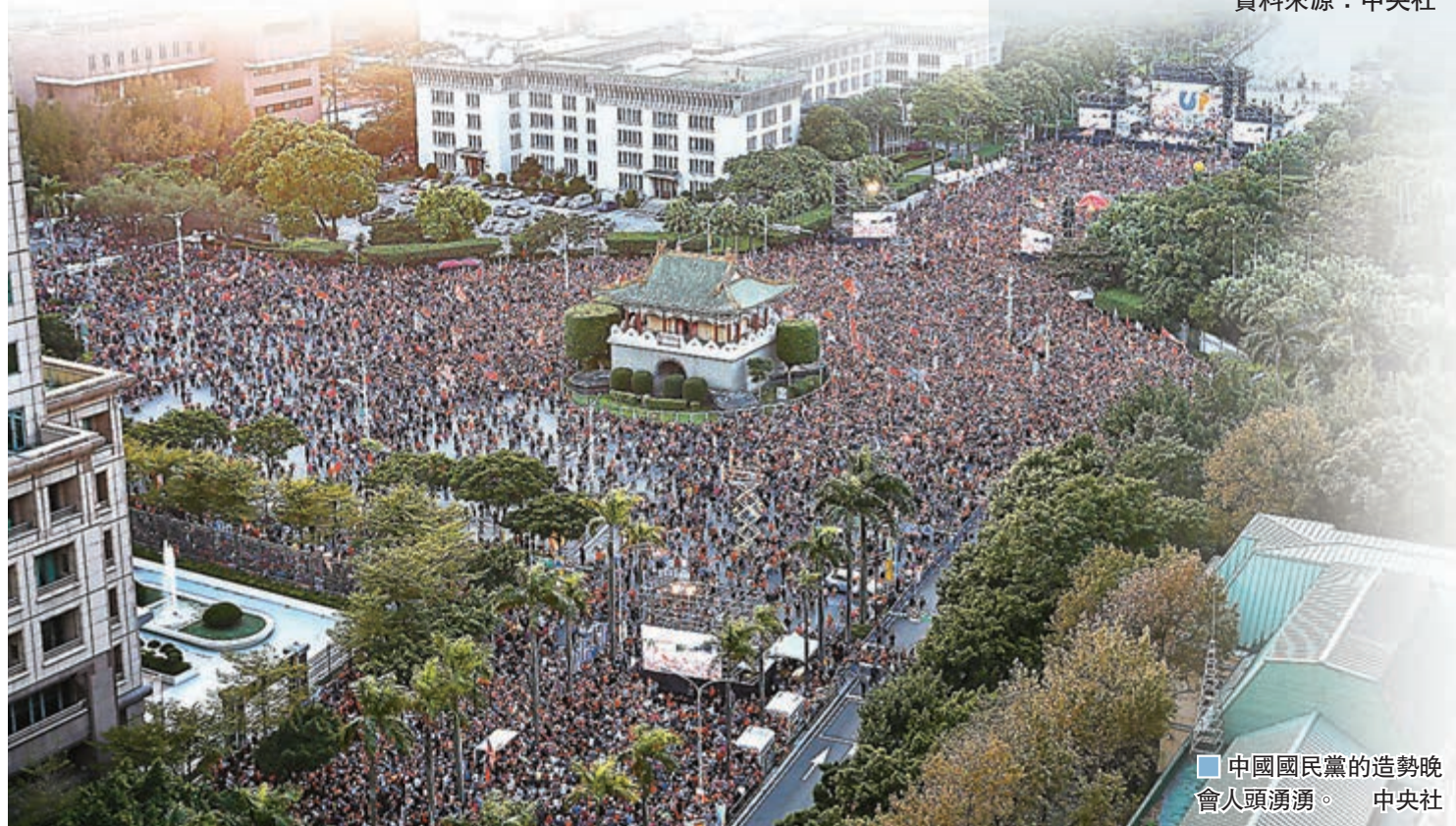
中國國民黨的造勢晚會人頭湧湧。