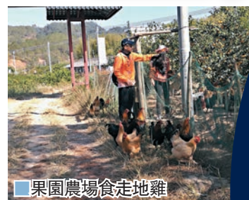
果園農場食走地雞