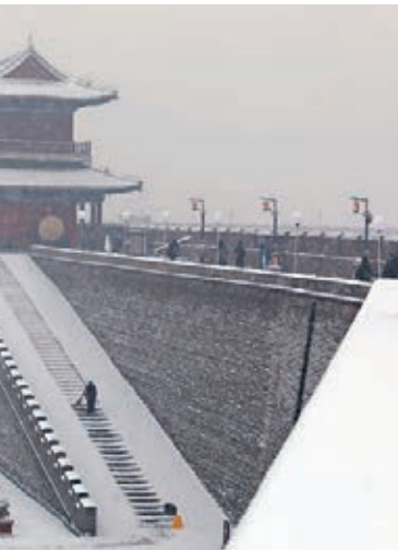
石家莊正定古城銀裝素裹