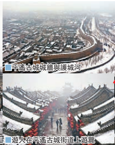
平遙古城城牆與護城河