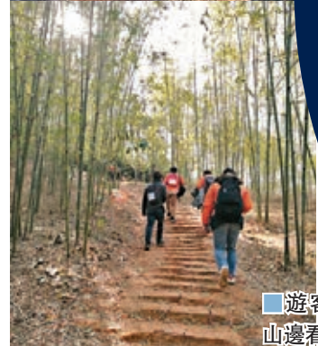
遊客遊行山邊看風景