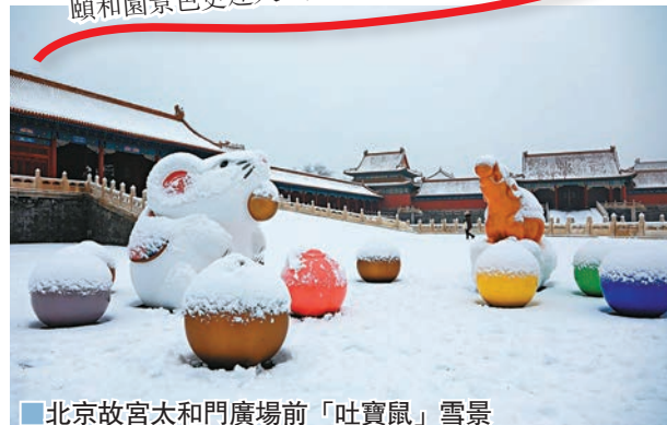
北京故宮太和門廣場前「吐寶鼠」雪景

日前，北京迎來2020年首場降雪，雪後的京城銀裝素裹，分外美麗。而且，雪後的頤和園景色更迷人，宛若畫卷。