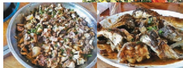
食農家原汁原味走地雞 新鮮農家菜

廣東省內論旅遊資源豐富的城市，韶關都應該入行，有山有水有人文歷史，因位於廣東省北部，粵北是唯一多機會落雪的地方，再加上處粵湘贛三省交界，市境西界清遠市，南臨廣州市、惠州市，東南接河源市，東北毗江西省贛州市，西北達湖南省郴州市，自然是出外省旅遊人必經之地。難怪韶關的交通網絡很成熟，包括高鐵挺方便，如果計行車時間由韶關到西九一個多小時已經夠了，此地漸成港人的消遣地。