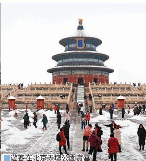
遊客在北京天壇公園賞雪