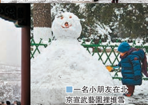
一名小朋友在北京宣武藝園裡堆雪