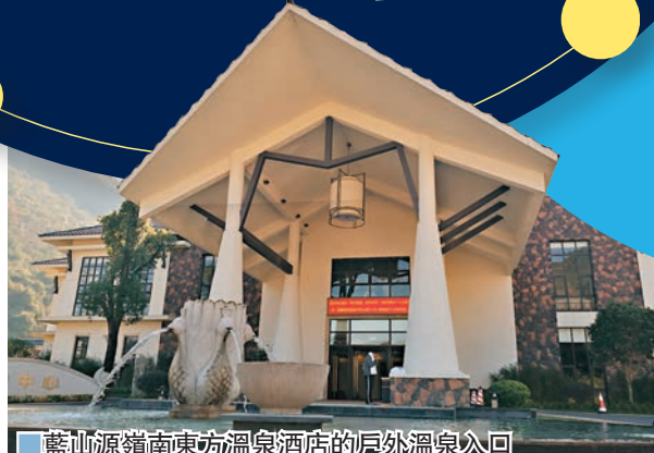
藍山源嶺南東方溫泉酒店的戶外溫泉入口