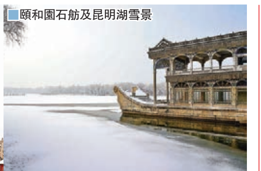
頤和園石舫及昆明湖雪景