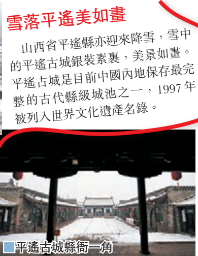
遊人在平遙古城街道上遊覽