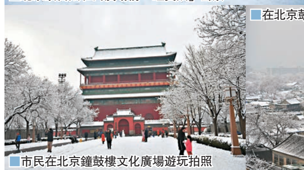
市民在北京鐘鼓樓文化廣場遊玩拍照