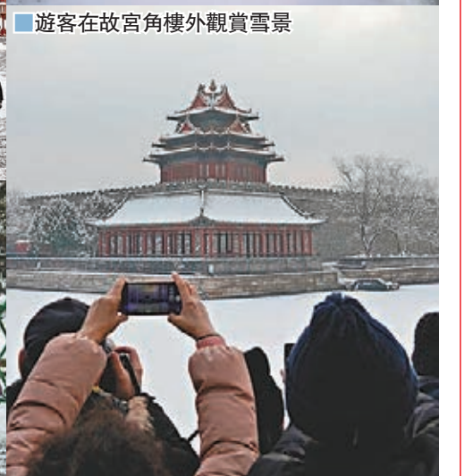
遊客在故宮角樓外觀賞雪景