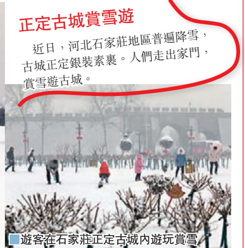
遊客在石家莊正定古城內遊玩賞雪