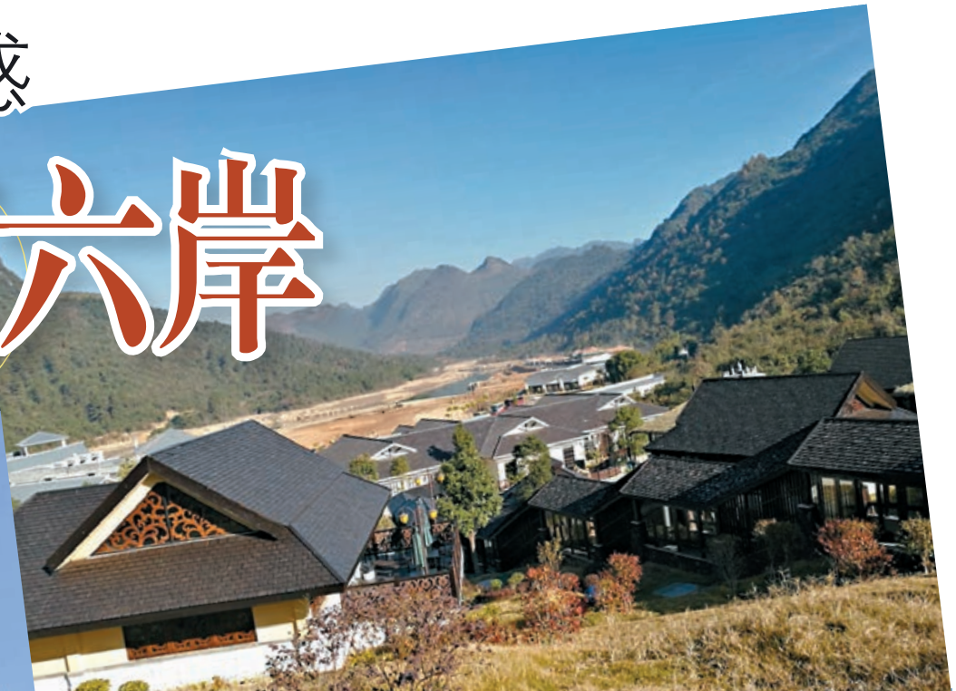
藍山源嶺南東方溫泉酒店