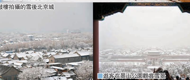
在北京鼓樓拍攝的雪後北京城