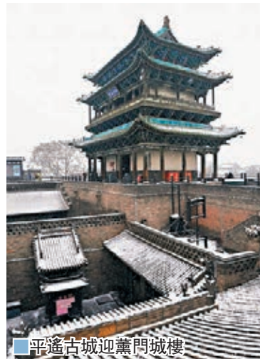
平遙古城迎薰門城樓

山西省平遙縣亦迎來降雪，雪中的平遙古城銀裝素裹，美景如畫。平遙古城是目前中國內地保存最完整的古代縣級城池之一，1997年被列入世界文化遺產名錄。