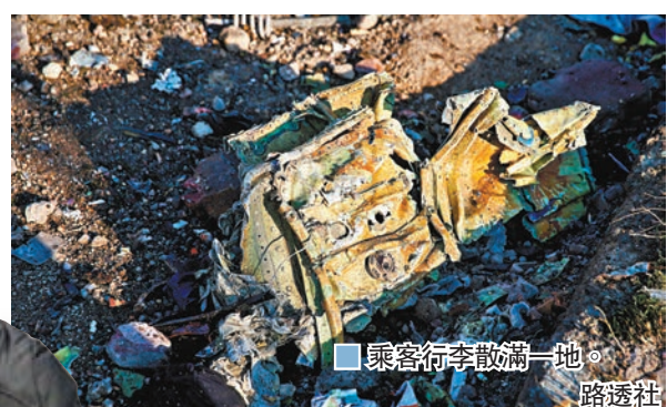
乘客行李散滿一地。

領空。多間國際航企其後亦宣佈，在中東的航線將會繞道，避過兩伊領空。而波音客機在伊朗墜毀的空難，則是在 FAA 發出禁令後發生。