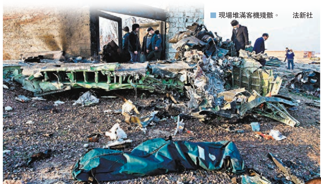
現場堆滿客機殘骸。法新社