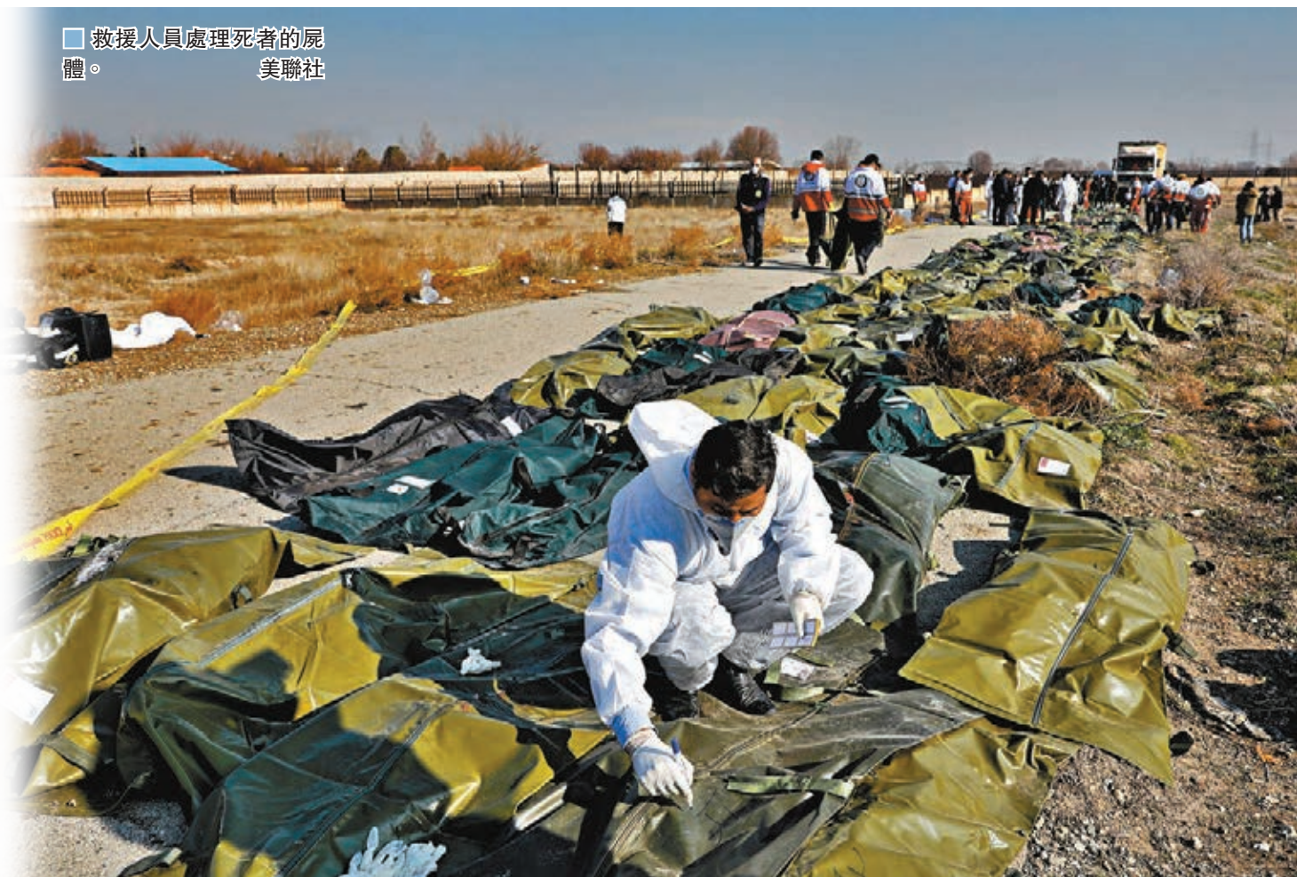
救援人員處理死者的屍體。