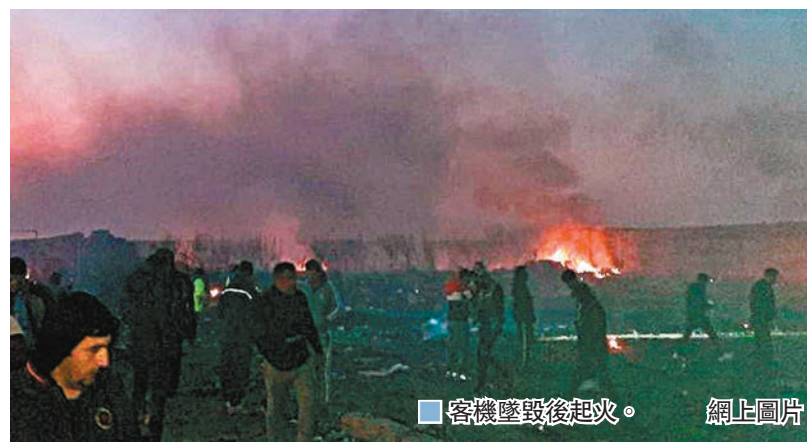
客機墜毀後起火。網上圖片