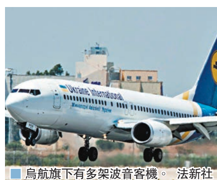
烏航旗下有多架波音客機。

昨日在伊朗墜毀的客機由烏克蘭國際航空營運，而烏航旗下客機多年來不時出現技術故障問題，今次則是首次發生空難。