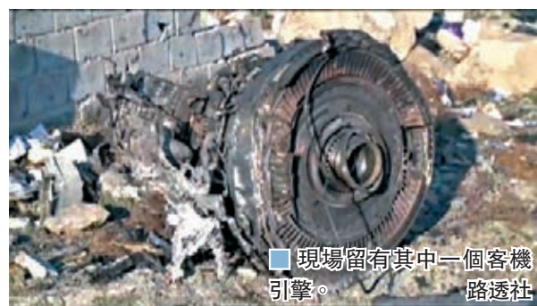
現場留有其中一個客機引擎。