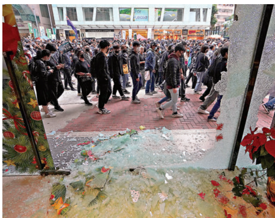
2020年元旦下午，蒙面黑衣人利用遊行隊伍做掩護，破壞位於灣仔軒尼詩道的中國人壽大廈正門，大門玻璃被砸碎，碎片散落一地。