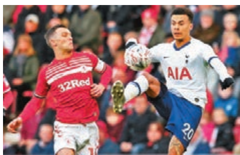
熱刺中場迪利阿里(右)是役欠缺近數周比賽的佳態。