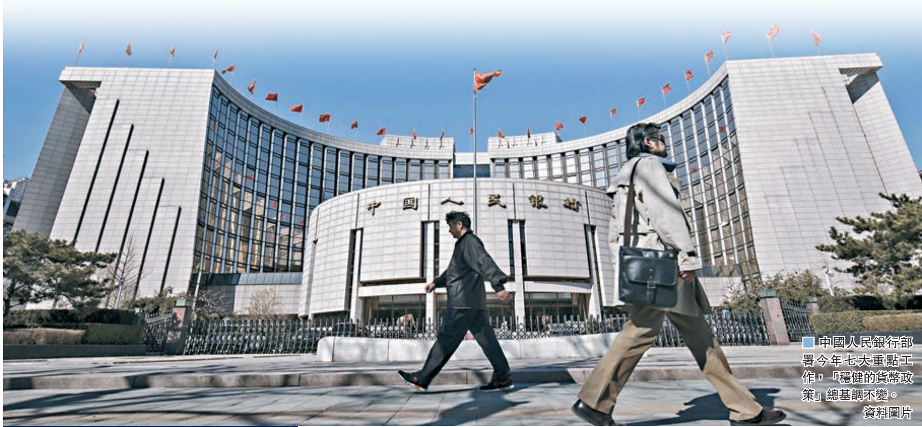
中國人民銀行部署今年七大重點工作，「穩健的貨幣政策」總基調不變。

香港文匯報訊（記者海巖北京報道）中國人民銀行近日在京召開2020年工作會議，部署今年七大重點工作，「穩健的貨幣政策」總基調不變，但從保持「鬆緊適度」變為「靈活適度」。另外，央行強調「堅決打贏防範化解重大金融風險攻堅戰」，首次提出「加快建立金融委辦公室地方協調機制」，「擴大宏觀審慎政策覆蓋領域」，並專門提到加快金融科技研發和應用。