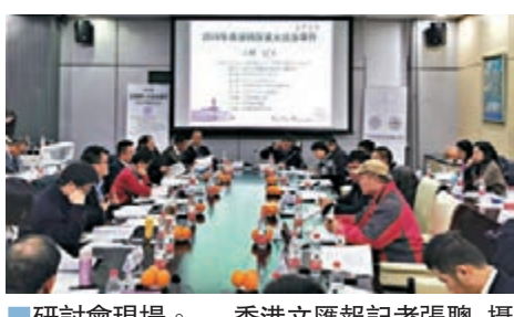
研討會現場。

當選的澳門法治事件包括：全國人大常委會通過《關於授權澳門特別行政區對橫琴口岸澳方口岸區及相關延伸區實施管轄的決定》、慶祝澳門回歸祖國20周年暨澳門特別行政區第五屆政府就職典禮。