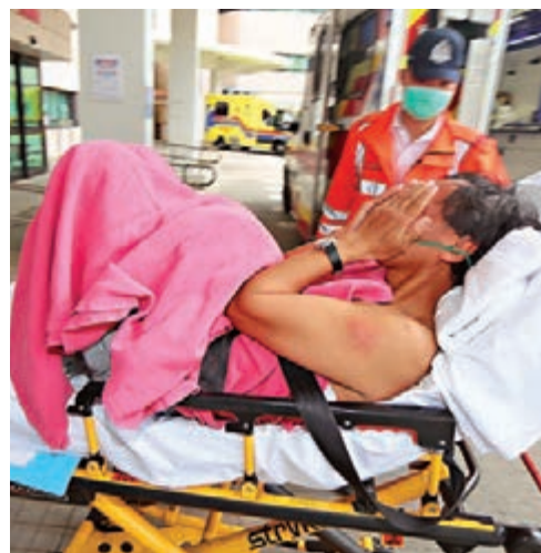
多名遠足者被黃蜂螫傷送院治理。

為推廣CGAS的服務理念，新界西醫院聯網今年推出了25周年特別刊物《跳出框框 繼續照顧你》，輯錄多個真實外展個案，讓長者、家屬和院舍更多了解這項走進社區的醫療服務。