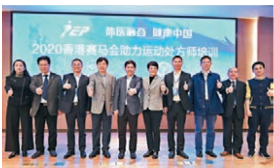
香港賽馬會助力運動處方師培訓班在深開班。

香港文匯報訊(記者 郭若溪 深圳報道)1月5日,2020香港賽馬會助力運動處方師首期培訓班在深圳開班。運動處方師培訓由國家體育總局體育科學研究所與中國體育科學學會主辦,香港賽馬會贊助,將分別於1月、3月、5月在深圳、上海、廈門三地舉辦,完成300餘名家庭醫生、全科醫生和社區醫生的培訓任務,合格者將獲得中國體育科學學會頒發的運動處方師證書。此次培訓班旨在培養一支能開具個性化運動處方的醫生隊伍,助力全民健身和健康中國建設。