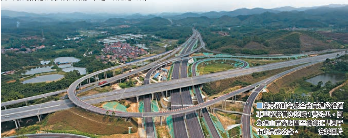
廣東預計年底全省高速公路通車里程將首次突破1萬公里。圖為佛山市高明區至儋州江門恩平市的高速公路。資料圖片