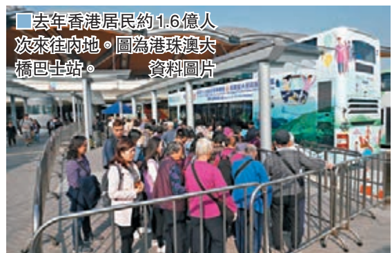
去年香港居民約1.6億人次來往內地。圖為港珠澳大橋巴士站。

水平對外開放。國家移民管理局在北京、上海等18個口岸設置了89條「一帶一路」邊檢通道,為29萬人次提供快速通關便利。海南入境旅遊實施30日免簽政策,惠及外國人46.3萬人次,佔海南入境外國人總量73.7%。此外,還在京津冀、長三角、廣東等地推行外國人144小時過境免簽政策,邊檢機關為逾180萬人次外國人提供各類過境免簽便利。