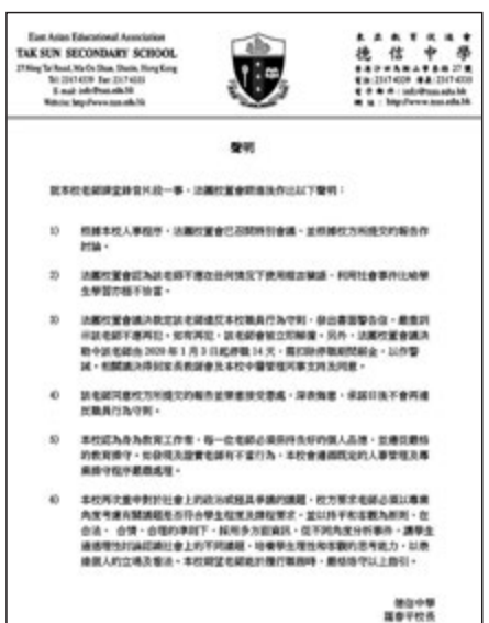
德信中學發出通告，指涉事教師已被勒令停職14天。

香港文匯報訊（記者 高鈺）教師是培育下一代的重要專業，不論政治立場為何，失德言行並不能以所謂「言論自由」開脫。上月有網上錄音流傳，指德信中學一名男教師在校內處理及訓斥學生違規行為時，曾以示威者的不當行為作比對，言詞間提到「全部甲由都係咁」及粗口字眼，校方當時表明會作紀律研訊。昨日，該校校長羅春平發聲明，指法團校董會已向該老師發書面警