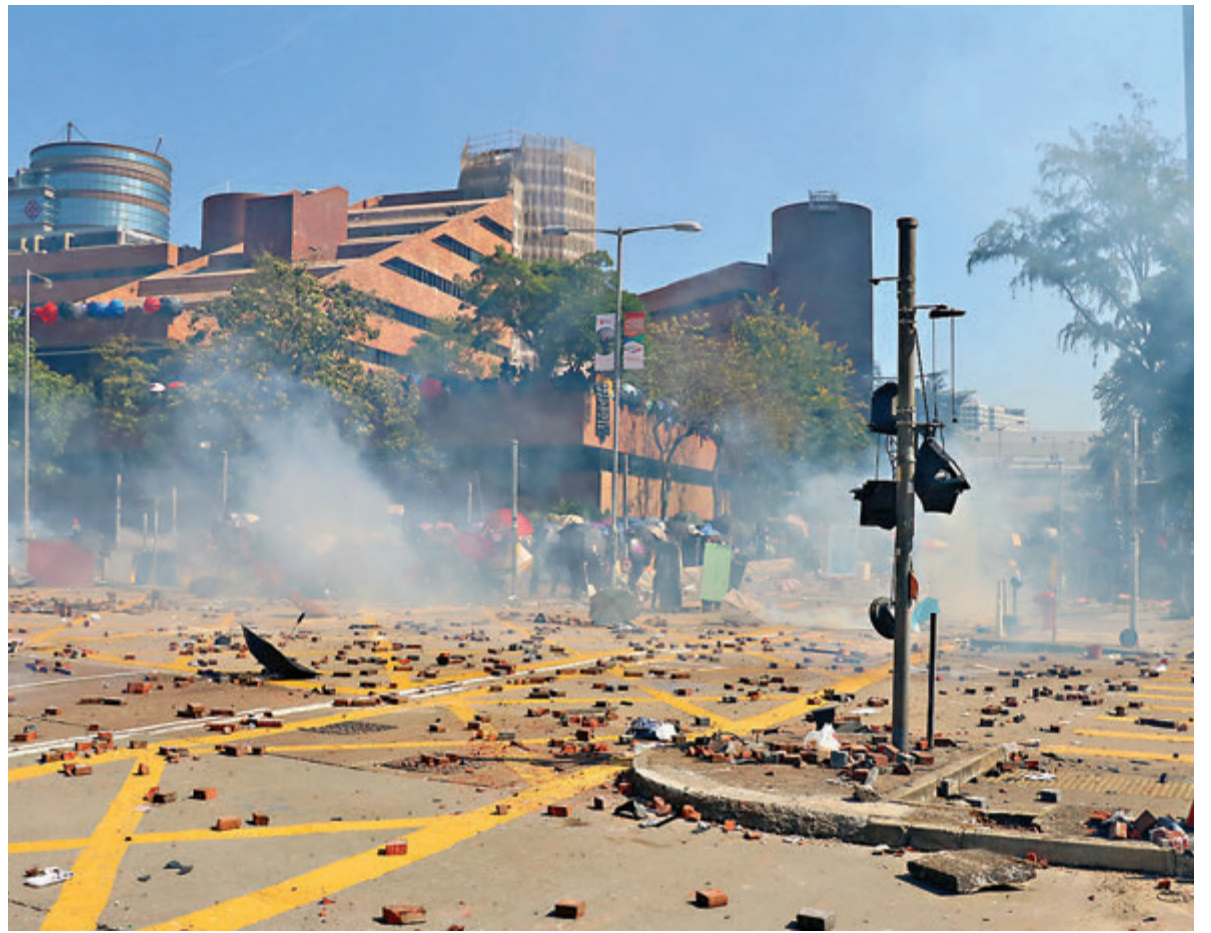
環境測試證實，理大、中大及科技園的二噁英等物質含量均遠低於安全標準，對健康的危害微不足道。圖為日前理大前線現場。

另外，香港科技園公司亦委託獨立認可實驗室，去年12月初於園區4個室外地點，包括最接近中大附近範圍，收集空氣、水質及泥土樣本。昨日公佈的結果顯示，有關化學物質水平（包括二噁英）均低於本地或國際的安全標準限值。