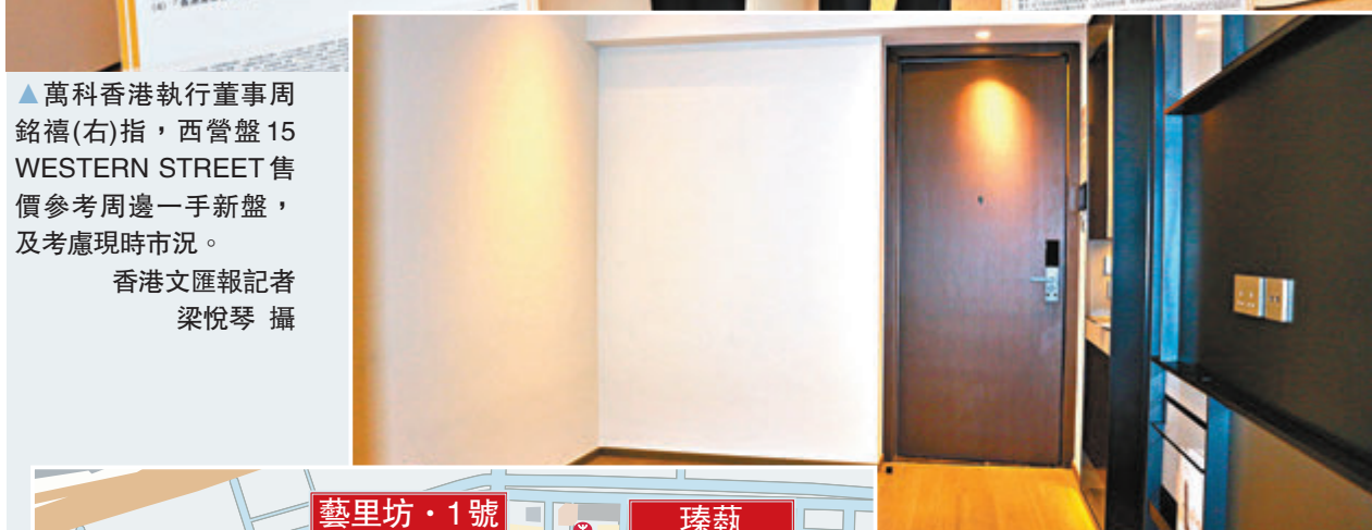
▲15 WESTERN STREET的213方呎開放式示範單位。