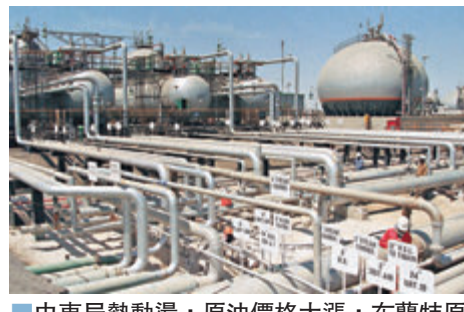
▲中東局勢動盪，原油價格大漲，布蘭特原油價格急漲4.4%，衝破69美元。

大摩調升港交所目標價一成至310元，美銀亦上調港交所目標價，由260元升至268元。該行相信，繼阿里巴巴(9988)後，未來將有更多在美國掛牌的中概股來港作第二上市，即使公司規模比阿里要小。