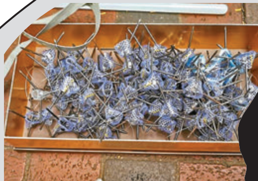
警方檢獲95枚鐵蒺藜。