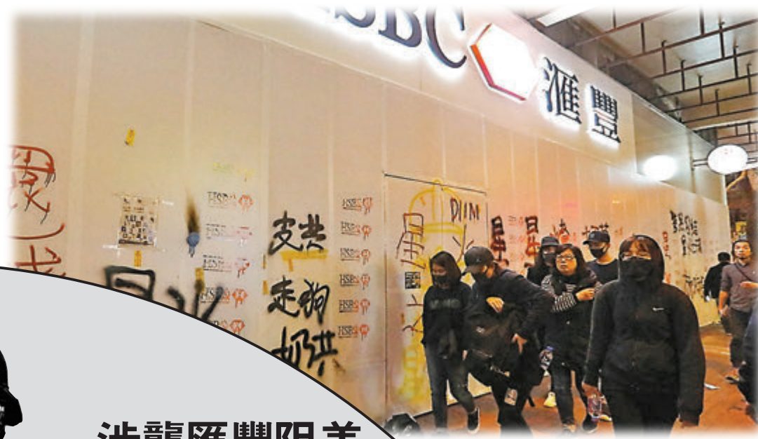
▲ 黑人刑毀匯豐銀行的玻璃門及木圍板。