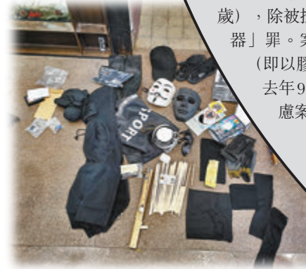
▲ 黑衣人帶備各種裝備暴衝。