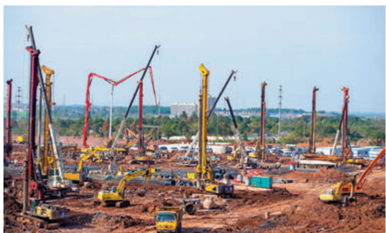
惠科第8.6代超高清新型顯示器件生產線項目建設現場（拍攝於12月初）

近年來，瀏陽經開區始終堅持「項目為王」發展理念，圍繞高端要素和高端產業集聚，把項目作為提升經濟總量、增強綜合實力、聚集發展後勁的根本，全力推進重點項目建設，不斷擴大投資規模，助推園區經濟社會轉型升級發展。