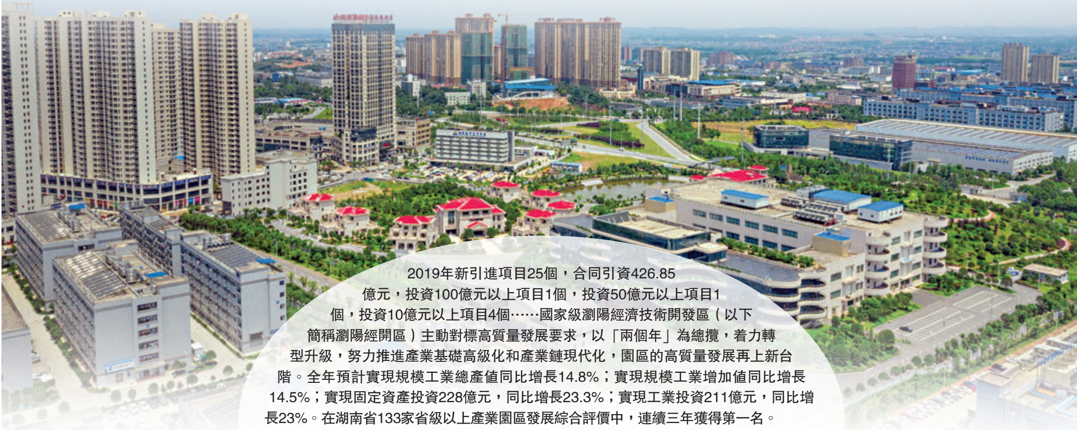
蓬勃發展的瀏陽經開區

2019年新引進項目25個，合同引資426.85億元，投資100億元以上項目1個，投資50億元以上項目1個，投資10億元以上項目4個……國家級瀏陽經濟技術開發區（以下簡稱瀏陽經開區）主動對標高質量發展要求，以「兩個年」為總攬，着力轉型升級，努力推進產業基礎高級化和產業鏈現代化，園區的高質量發展再上新台階。全年預計實現規模工業總產值同比增長14.8%；實現規模工業增加值同比增長14.5%；實現固定資產投資228億元，同比增長23.3%；實現工業投資211億元，同比增長23%。在湖南省133家省級以上產業園區發展綜合評價中，連續三年獲得第一名。