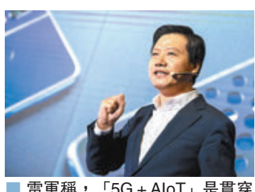
雷軍稱，「5G+AIoT」是貫穿集團全產品、全平台、全場景的服務能力。

2019年年初，小米提出All in AIoT，5年投入100億元，經過這一年的實踐充分驗證了戰略方向的可行性、正確性和戰略投入的必要性。今年會進行加碼升級，雷軍表示未來5年小米將至少投入500億元，把AIoT、智能生活的持續優勢轉化為智能全場景。