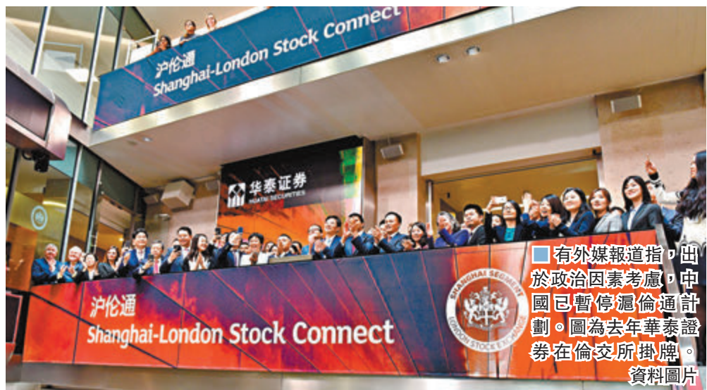
有外報報道指出，由於政治因素考慮，中國已暫停滬倫通計劃。圖為去年華泰證券在倫交所掛牌。資料圖片

香港文匯報訊(記者 章羅蘭 上海報道)去年6月正式「通航」的滬倫通，半年來進展不大，昨日更有外報報道指，出於政治因素考慮，中國已暫停滬倫通計劃。截至發稿，上述消息並未得到官方確認。華泰證券全球存託憑證(GDR)在倫敦跌11%。不過，內地市場人士在接受香港文匯報採訪時直言，即使消息屬實，因初期規模有限，滬倫通暫緩在A股交易層面不會產生太多影響。