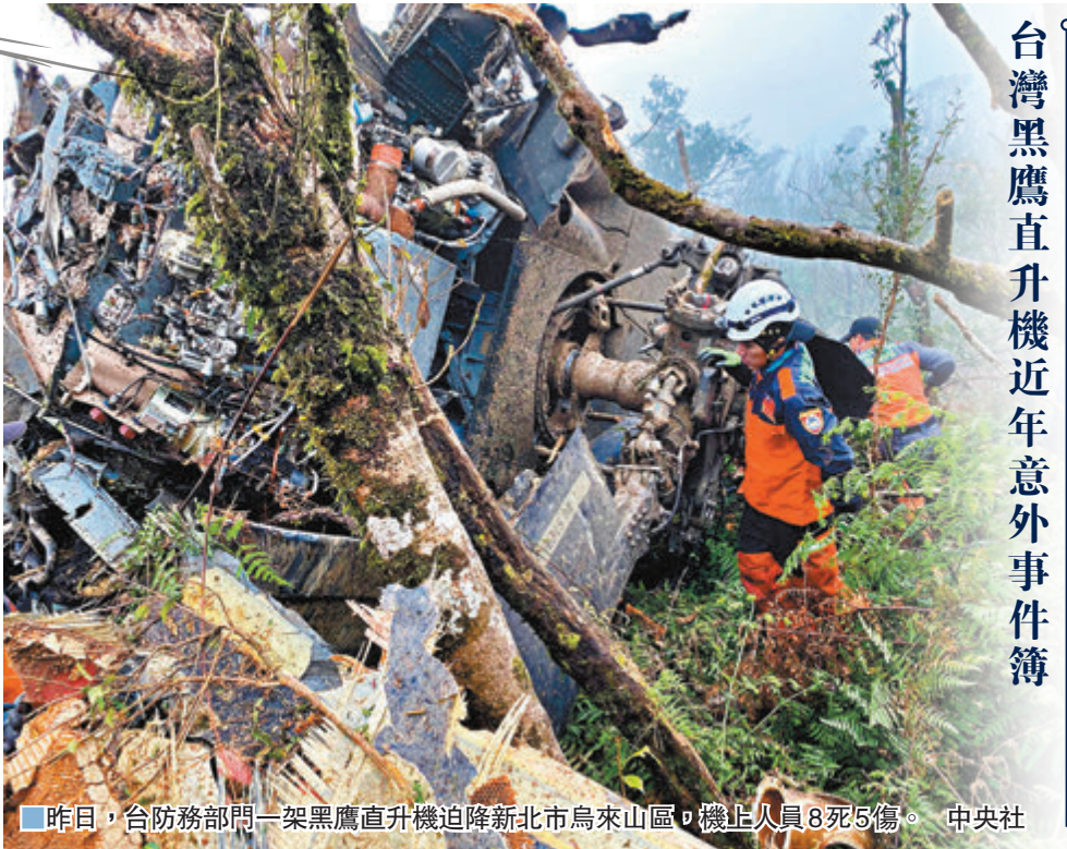
■昨日，台防務部門一架黑鷹直升機迫降新北市烏來山區，機上人員8死5傷。

香港文匯報訊 據中通社報道，台灣防務部門一架黑鷹直升機昨日上午在新北烏來與宜蘭交界山區迫降墜毀，防務部門下午召開記者會證實，包括「參謀總長」沈一鳴等8人罹難，軍聞社記者陳映竹等5人生還。