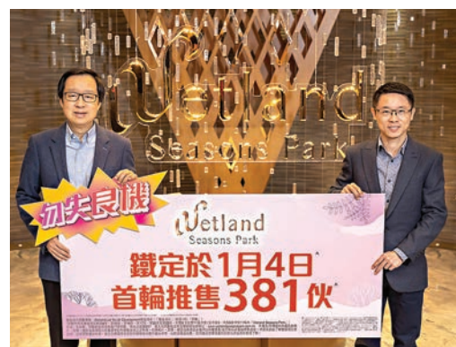
雷霆（左）表示，項目收票理想，將視乎周六銷情考慮再加推。

新盤成交方面，中國海外旗下啓德一號(II)連沽兩伙複式戶，市傳買家為同一組客人，總值1.207億元，單位為低座第16座1、2樓及3、5樓兩個複式戶，實用面積同為2,414方呎，呎價均為2.5萬元。