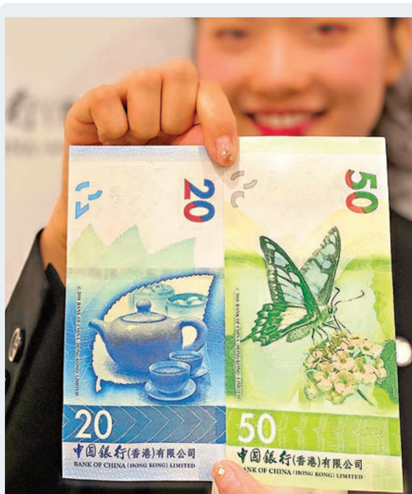
中銀香港將推出農曆年新鈔及「迎新鈔」兌換服務。圖為中銀香港2018新系列50及20港元鈔票。

對於房地產市場的影響，專家認為此次降準央行已提早做政策準備，近幾個月銀保監會實施了一輪嚴厲的房地產監管新政，以保障資金真正支持實體經濟發展，防止資金流向房地產領域。未來一段時間，房地產金融政策仍會持續收緊。