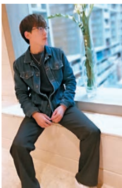
姜勳能坦言太久沒有和家人在新年一起過節。