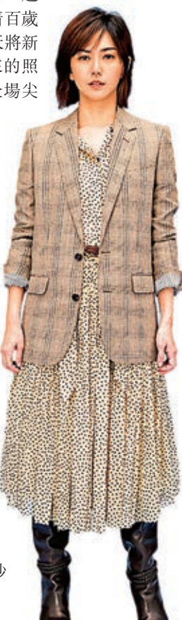
孫燕姿為藍色三部曲的《溫柔》獻聲及拍MV。