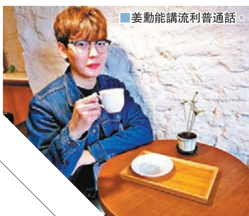
姜勳能講流利普通話。

孫燕姿好奇阿信@五月天單身之謎 香港文匯報訊 31號跨年當天，台灣樂團五月天連走兩場。回顧20年前的跨年夜，成員冠佑說：「那時只有我們五個，怪獸、石頭彈結他，五個人彈唱唱想到什麼唱什麼，只有我們五個，那時很滿足，但20年後的今天，跨年夜跟着2.5萬個歌迷度過，又是不同的溫暖與滿足。」 冠佑許下新年願望，希望和歌迷10年後、20年後，甚至50年後，年年都要一起跨年，阿信笑說：「希望屆時大家對着百歲的老伯伯，還有興趣話當年。」五月天將新年願望留給歌迷：「謝謝你們20年來的照顧未來20年跟五月天瘋瘋癲癲。」全場尖叫回應。 在2020嶄新的一年的第一刻，五月天送上音樂新年禮「藍色三部曲」第三部曲，《溫柔》數位音檔在1月1日凌晨0點正式上架，MV首播更在2020第一天首播，《溫柔》20周年版再度力邀天后孫燕姿「溫柔」獻聲。 拍攝MV當天，孫燕姿一當完首場嘉賓，儘管身體微恙，一刻都未休息，就直奔片場拍攝，相當敬業。為了盡善盡美，事前錄製時，不斷地隔空與五月天來回溝通討論，不僅對演唱會服裝用心，連MV造型也找了多套衣服定裝，十分重視與五月天的合作，她說：「很開心能再次跟五月天合作，他們的歌是人人青春、愛情的象徵。」提及愛情的象徵，孫燕姿也好奇主唱阿信的感情，驚問：「怎麼還單身？」工作人員妙答：「因為錯過你」，逗樂孫燕姿。