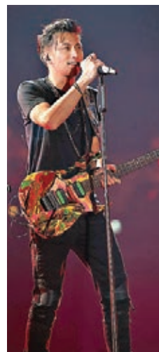
霆鋒亮相江蘇衛視跨年騷。

另外，由於元旦是言承旭的43歲生日，浙江衛視特地準備蛋糕為言慶祝。說到生日願望，言承旭表示：「2019年對我來講是很特別的一年，因為發生了很多事情，在這邊希望大家都可以在2020年健康，還有一個願望就是我新拍完的戲叫做《交換吧！運氣》，2020年希望有更多的時間和機會可以來這邊跟大家見面。」