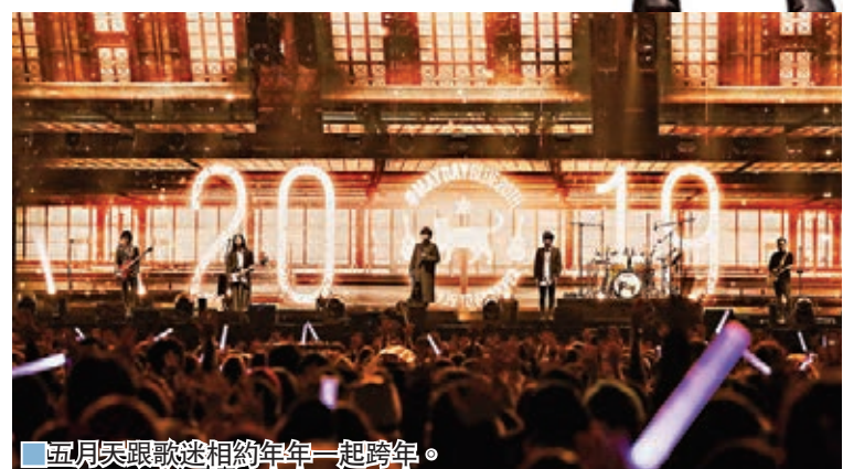
五月天跟歌迷相約年年一起跨年。