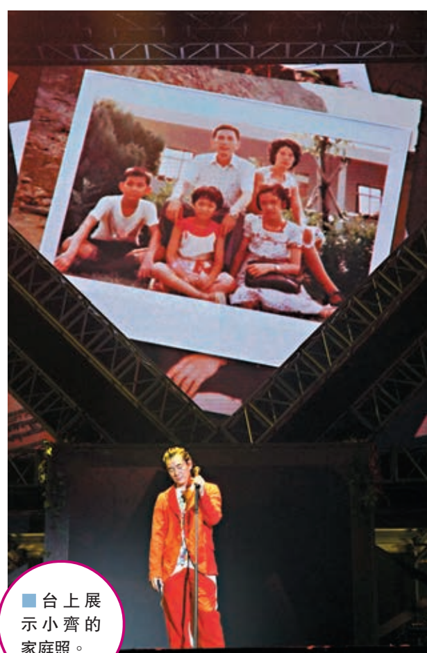
台上展示小齊的家庭照。