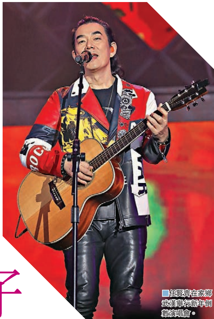
任賢齊在家鄉武漢舉行新年倒數演唱會。