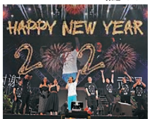
任賢齊跟歌迷一起歡迎2020。

小齊前晚於武漢舉行兩場《齊跡2019世界巡迴演唱會》，跟歌迷一起歡迎2020。此行小齊更帶着父母前來捧場，再回鄉下，任爸曾對小齊說，可能是最後一次回家了，讓小齊聽着也很感慨。為了盡孝讓爸媽開心，所以小齊演唱會再忙也不理自己休息時間，一大早就爬起來，陪爸媽四處逛逛，帶爸媽遊武漢東湖及博物館，令父母開心不已，但倒數演唱會後，他累得九秒九就倒頭大睡。