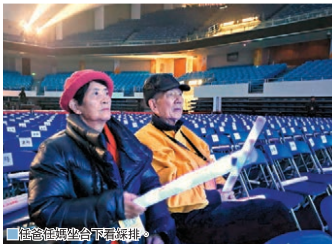
任爸任媽坐下看綵排。