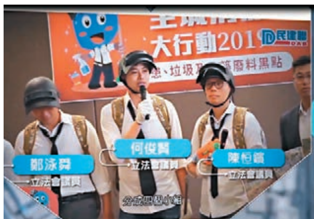
民建聯關注環境衛生。左圖為「全城清潔大行動2019」；右圖為關注鼠患問題。