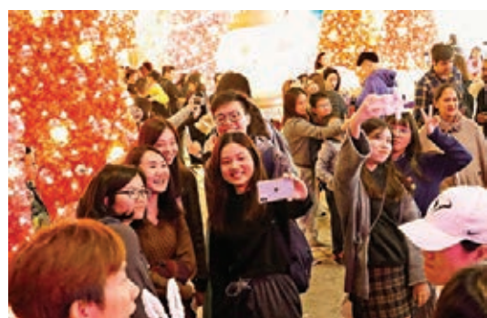
香港市民期望新年香江太平。

確保「一國兩制」實踐不變形、不走樣。特區政府服務市民的承諾與用心，無論面臨多大的艱難挑戰，也從未改變。去年11月4日，習主席在上海會見林鄭月娥行政長官時，深切表達了中央政府對特區政府的高度信任與充分肯定；十天後，習主席在巴西向全世界再次宣示中央政府的「六個堅定」；12月19日，習主席在澳門再次親切會見林鄭特首和管治班子，給予殷殷囑託。去年11月中旬中央還出台了惠港澳的16條新政策。中央政府這種強大氣場、大度包容、冷靜理智、堅定穩妥、關心厚愛、無私支持，讓香港廣大市民感到無比欣慰與熱切鼓舞，也為特區政府施政注入強大能量。可以毫不猶豫地說，法治始終是香港社會的堅實基礎，特區政府一定能帶領廣大市民走出當下困局，創造美好前程。 王國維先生所說的第三境界，是指經過多少次的挫折失敗，甚至是幾十年的艱苦磨練鑽研，終於柳暗花明，豁然領悟貫通，達至功到事成，在事業上作出有開創性的巨大貢獻。 香港回歸祖國22年來，「一國兩制」的成功實踐舉世公認。面對眼下的挫折，在歷史的長河中或許只是浪花一朵。破解當前的困局，追尋前行的出路，驀然回首，真正的出路，何嘗不是融入國家發展大局，發揮「一國之利」，善用「兩制之便」，以香港之所長，服務國家之所需。在這一方面，香港各界有識之士早已了然於胸，努力參與。有些市民在大灣區購房置業，有的年輕人把公司開到大灣區多個城市，越來越多的香港專