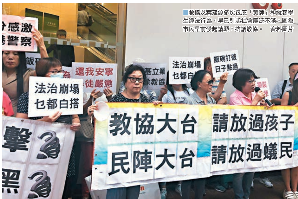
教協及葉建源多次包庇「黃師」和縱容學生違法行為，早已引起社會廣泛不滿。圖為市民早前發起請願，抗議教協。資料圖片