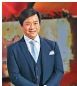
■ 唐季禮透露和成龍合作需要全面升級做好華人的超級動作片。

此次影片征戰春節檔，在片方陸續發佈的「新年衝鋒」預告片中，迪拜黃金車追擊、非洲雄獅逼人、瀑布九死一生等諸多重磅鏡頭首次浮出水面。《急先鋒》行動小隊輾轉倫敦、非洲、