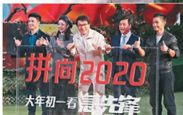
■ 《急先鋒》主角日前在廣州長隆開啓路演，提前預祝影迷元旦快樂。