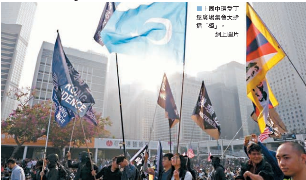
■上週中環愛丁堡廣場集會大肆播「獨」。