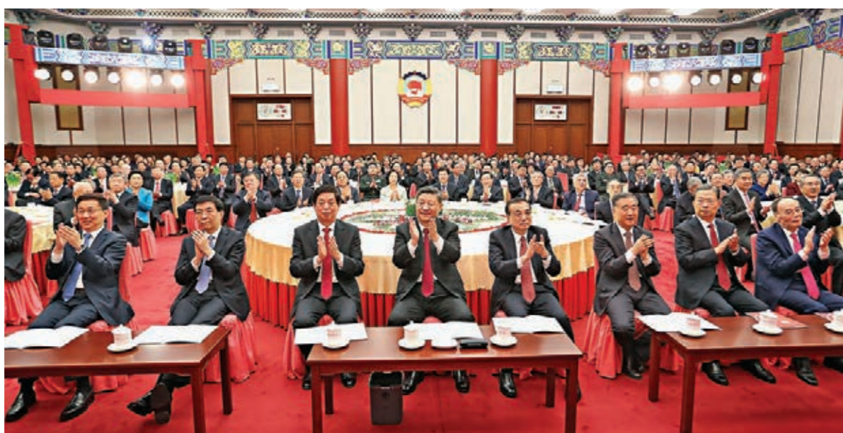
黨和國家領導人習近平、李克強、栗戰書、汪洋、王滸山、趙樂際、韓正、王岐山出席政協新年茶話會。

習近平強調，2020年是全面建成小康社會和「十三五」規劃圓滿收官之年。實現第一個百年奮鬥目標使命光榮、責任重大。我們要繼續貫徹「一國兩制」、港人治港」、「澳人治澳」、高度自治的方針，維護香港、澳門長期繁榮穩定。我們要堅持一個中國原則，在「九二共識」基礎上推動兩岸關係和平發展。我們要高舉和平、發展、合作、共贏旗幟，深化對外交流合作，積極推動「一帶一路」建設，為世界和平與發展的崇高事業作出新貢獻。