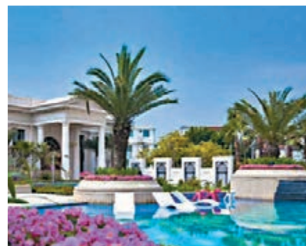
園林用不同植物劃分區域，保護業主的私隱。

由貝爾高林首席設計師譚偉業設計的園林也可圈可點：40,000平方米園林景致和7,000平方米自然水系，以棕櫚樹為主導，通過園林不同植物的層次作區域的分區，如有成人區、兒童區的泳池，有醫療救援專用的私人停機坪，還有高爾夫草坪等。業主在小區的活動可互不打擾，有相對隱秘的空間。