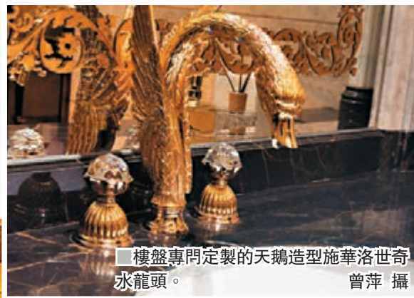
樓盤專門定製的天鵝造型施華洛世奇水龍頭。