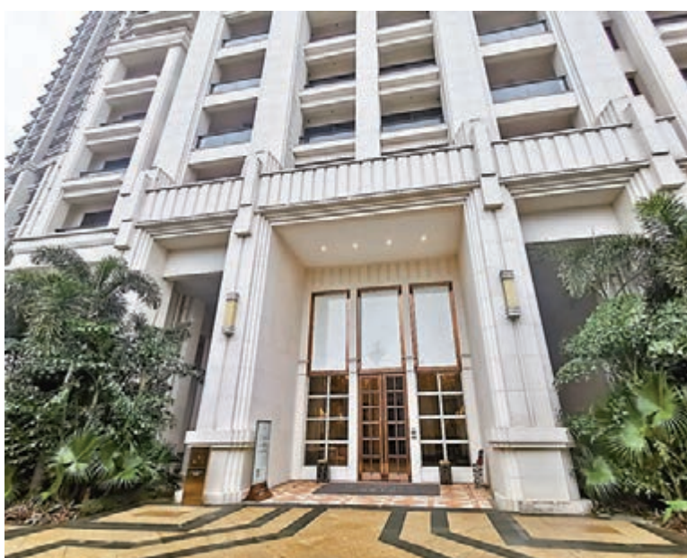
凱旋1號外立面用的是白宮「同款」石材。

據鄭泉介紹，凱旋1號所用石材共30多種，有意大利黑金花、希臘太子金、金絲玉、亞馬遜公主等等，每塊石材都有來頭：意大利黑金花被稱為「大理石之王」，一個完整的門套價值就相當於一輛奔馳車；電梯轎廂內採用了整塊的阿富汗七彩綠玉石，每塊都造價不菲；而太子金目前在市場上已絕跡，最後一批就用在凱旋1號的金色大廳內。