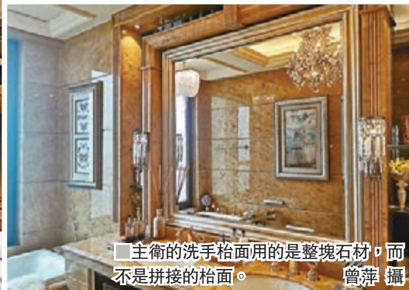
主衛的洗手枱面用的是整塊石材，而不是拼接的枱面。