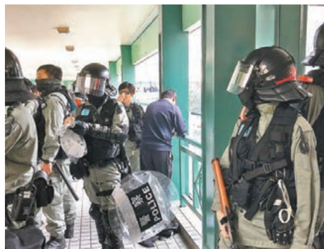
■警員截查一名12歲男童。

警方也分別在一名18歲男子及一名14歲女童身上檢獲鎗射筆、噴漆及鐵鎚, 他們分別涉嫌藏有工具可作非法用途及藏有攻擊性武器被捕。案件交由大埔警區重案組第二隊跟進。被捕者現正被扣留調查。行動中, 有5名男警務人員遇襲受傷, 他們清醒後送往那打素醫院治理。