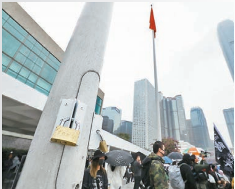
■香港大會堂外的旗杆加設兩把鎖, 以防暴徒再將國旗拆下。

根據《國旗及國徽條例》規定, 任何人公開及故意以焚燒、毀損、塗劃、玷污、踐踏等方式侮辱國旗或國徽, 即屬犯罪, 一經定罪, 可處第五級罰款及監禁3年。