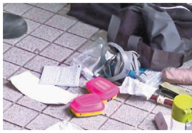
■警員在該名12歲男童身上搜出「豬嘴」。