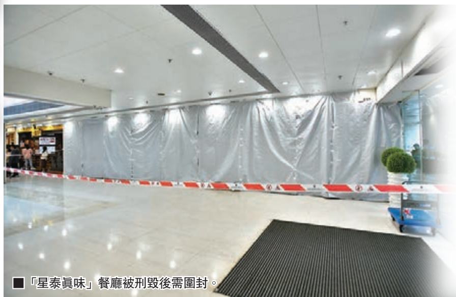
■「星泰真味」餐廳被刑毀後需圍封。

昨晨被破壞的「星泰真味」暫停營業, 並以白色帆布圍起, 工人在場清理玻璃碎, 店內仍見到熏黑痕跡。不過, 縱暴文宣仍不放過該餐廳, 不分青紅皂白硬指老闆和員工都是內地人, 又「老屈」餐廳負責人在26日報警拉暴徒, 並落井下石認為該餐廳抵死。