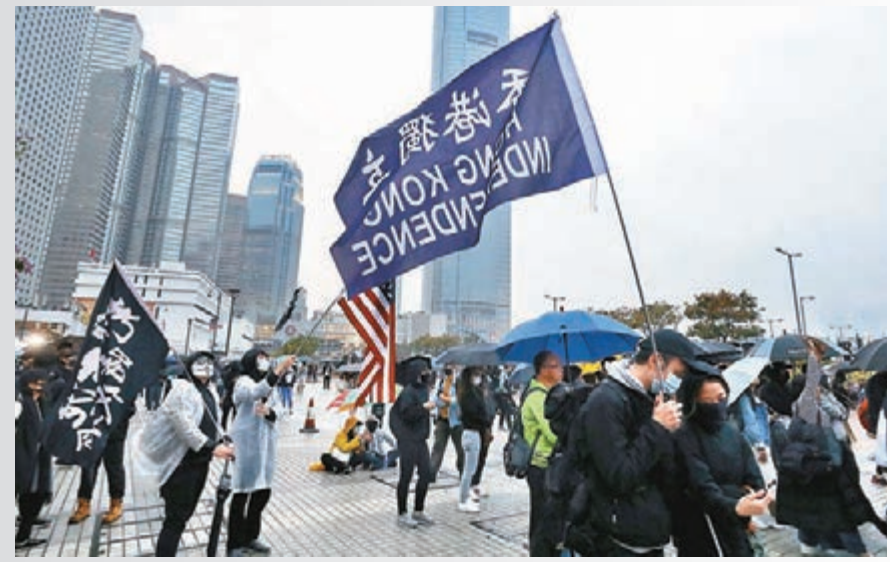
■中環愛丁堡廣場昨有黑衣人集會宣「獨」搞事。