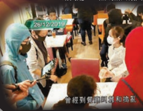
曾經到餐廳搗亂和搗亂