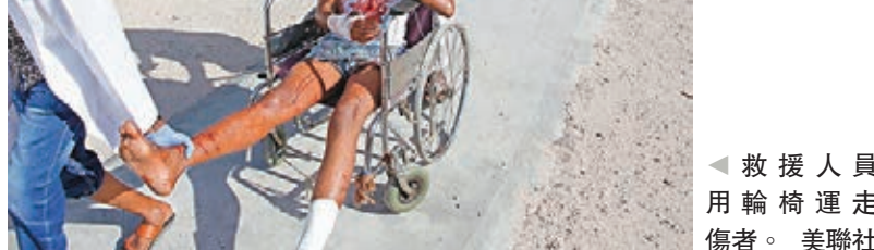
◀救援人員用輪椅運走傷者。