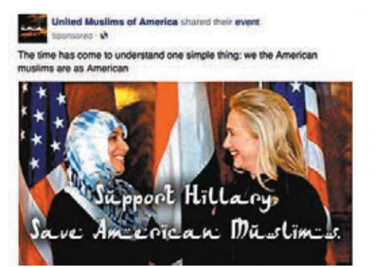
■不少含有虛假訊息的政治廣告近年充斥社交平台。

美國《廣告時代》雜誌首先披露該消息，並提到民主黨總統初選參選人桑德斯及共和黨全國委員會，均是Spotify的廣告客戶。共和黨數碼策略師威爾遜表示，Spotify的廣告平台之前未被廣泛用於競選宣傳，但隨著其他網上廣告平台限制政治廣告，客戶不得不尋找新渠道，而