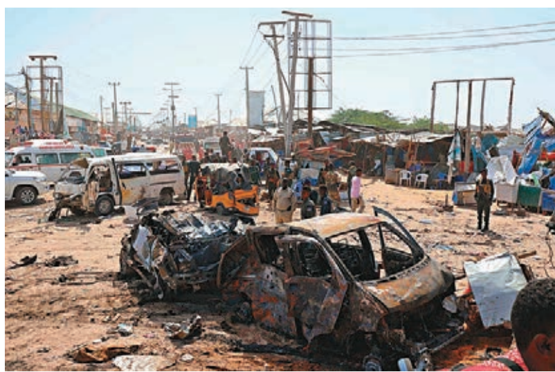
▲摩加迪沙的汽車炸彈襲擊導致至少90人死亡。