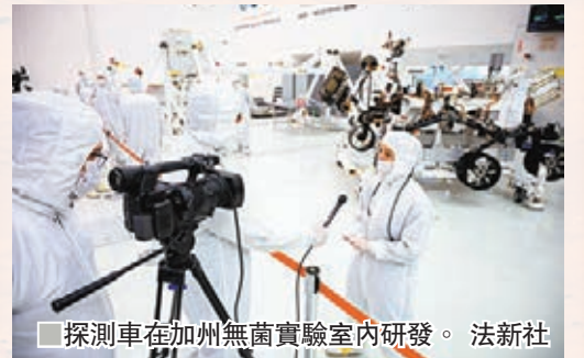
探測車在加州無菌實驗室內研發。

美國太空總署(NASA)的「火星2020」項目探測車將於明年升空，一如美國過去升空的太陽系外探測器「航海者」號、木星探測器「伽利略」號及土星探測器「卡西尼」號，NASA這次火星之行，同樣是始於加州帕薩迪納的無菌實驗室。