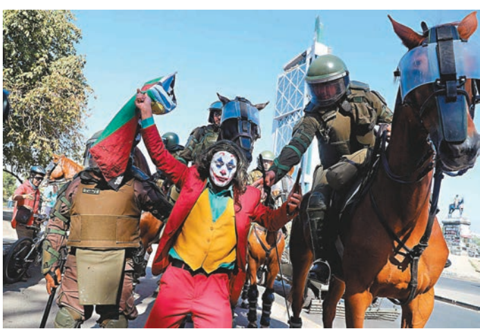
■有示威者打扮成電影人物小丑。

韓國K-POP文化的粉絲所有，試圖顯示當地動盪局勢是受外國影響。有群眾前日在首都聖地亞哥發起「K-POP集會」，抗議情報部門的說法，其後部分示威者與警方衝突，警方動用水炮及催淚彈驅散。附近的阿拉梅達藝術中心其間着火焚燒，嚴重損毀，消防員指未能確定起火原因。