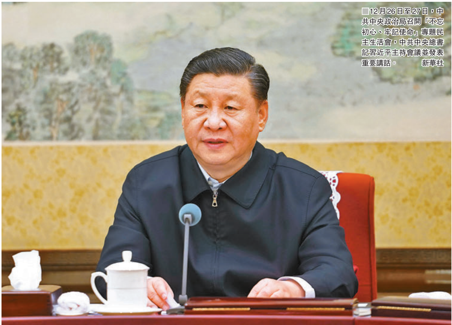
■12月26日至27日，中共中央政治局召開「不忘初心、牢記使命」專題民主生活會，中共中央總書記習近平主持會議並發表重要講話。