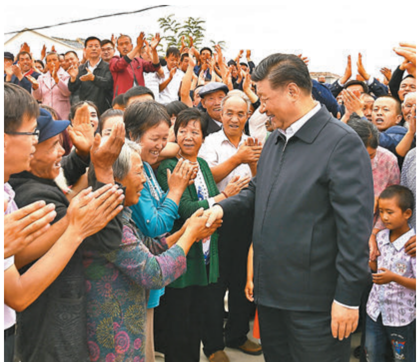
■習近平強調，以百姓心為心，與人民同呼吸、共命運、心連心，是黨的初心，也是黨的恒心。圖為今年8月，習近平在甘肅武威市古浪縣黃花灘生態移民區富民新村，了解易地搬遷群眾生產生活及脫貧致富情況。

習近平強調，在這次專題民主生活會上，中央政治局的同志主動找差距、找不足，就做好工作提了許多很好的意見和建議，有的涉及中央工作，有的涉及部門工作，有的涉及地方工作，會後要抓緊研究、拿出舉措、改進工作，務求取得實效。