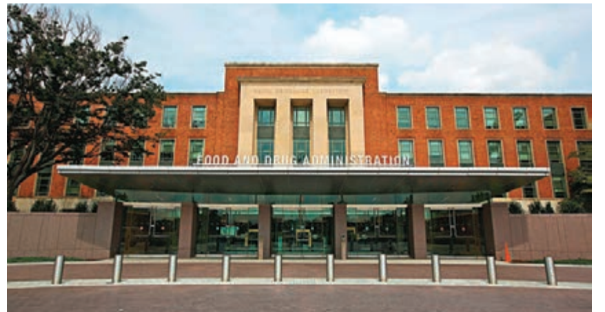
圖為美國食品及藥品監督管理局總部。

江宜度認為，藥價議題引起的市場疑慮逐漸淡化，且由美國政府直接與藥廠議價讓市場質疑公正，故預期藥