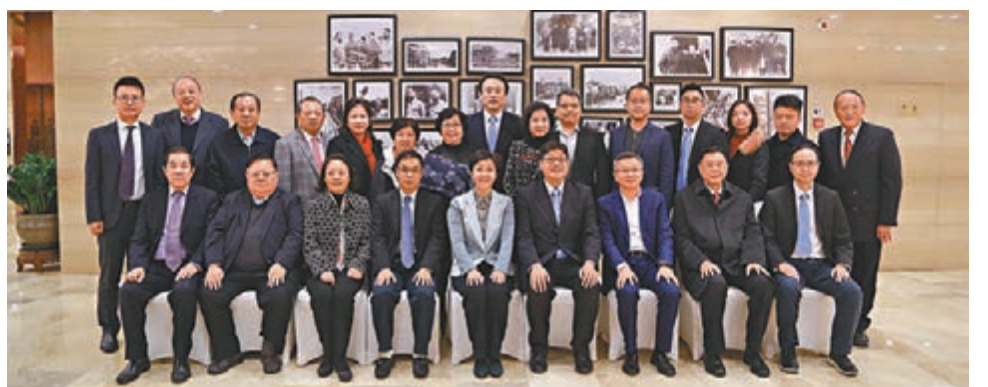
■重慶市委常委、統戰部部長李靜會見港僑聯會訪問團,賓主合影。

劉以勤稱,港僑聯會是香港僑界最具影響力和代表性的社團組織,是愛國愛港的中堅力量。她希望中聯辦、香港僑團能加強與四川的合作,繼續宣傳、推介、投資四川,推動更多港資企業赴川投資興業,助力鄉村振興、脫貧攻堅、公益慈善等事業,不斷提升