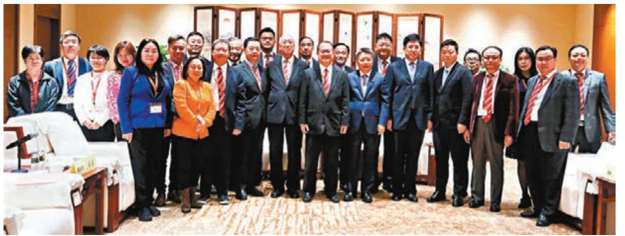
■中總考察團與三亞市委書記童道馳(前排右五)及市長阿東(前排右四)會面。

他續說,目前海南不斷改善投資環境、引進人才,海口及三亞多個園區正有不少投資興業的機會,呼籲香港工商界抓緊商機,而在發展為自貿區及自貿港的進程中,海南將為港及廣大投資者提供便利、開放、高效