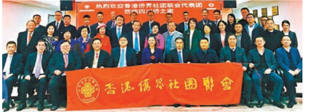
■四川省僑聯與港僑聯會訪問團進行交流。