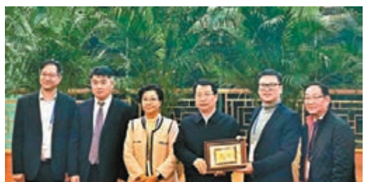
▲天津市委統戰部領導與參訪團代表合影。