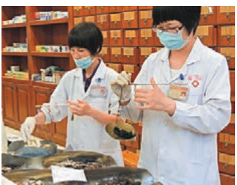
粵港澳大灣區探索構建三地共享的中醫醫療保健體系。香港文匯報記者方俊明 攝

在建設大灣區中醫藥創新平台的同時,推動粵港澳中醫藥重點實驗室、科研機構資源共享,還將探索構建粵港澳共建共享的中醫醫療與預防保健服務體系。