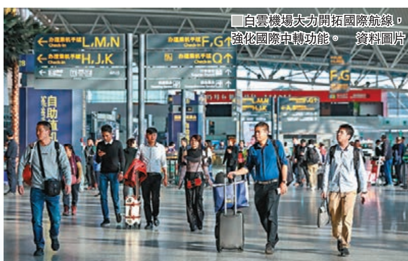
白雲機場大力開拓國際航線,強化國際中轉功能。

對此,鄧建清表示,由於眾所周知的原因,香港國際機場的進出境旅客和整體情況確實有些不樂觀。「香港機場暫時遇到一些困難,而白雲機場穩步增長,但由於兩大機場年終數據