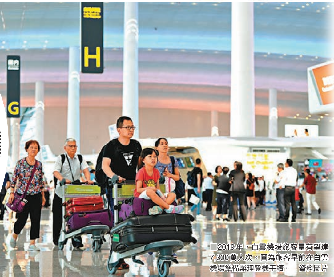
2019年,白雲機場旅客量有望達7,300萬人次。圖為旅客早前在白雲機場準備辦理登機手續。

香港文匯報訊(記者 敖敏輝 廣州報道)昨日,香港文匯報記者從廣州空港委獲悉,今年以來,白雲機場旅客吞吐量實現穩步增長,至12月中旬,旅客量累計實現7,000萬人次,全年有望超過7,300萬人次,躋身全球十大國際航空樞紐。據了解,香港機場上半年旅客量超出白雲機場近220萬人次,而受暴亂局勢負面影響,香港機場在10月被白雲機場超越,11月底白雲機場已超香港機場128萬人次。這也意味着,2019年白雲機場旅客吞吐量將極大概率歷史性地首次超越香港機場。